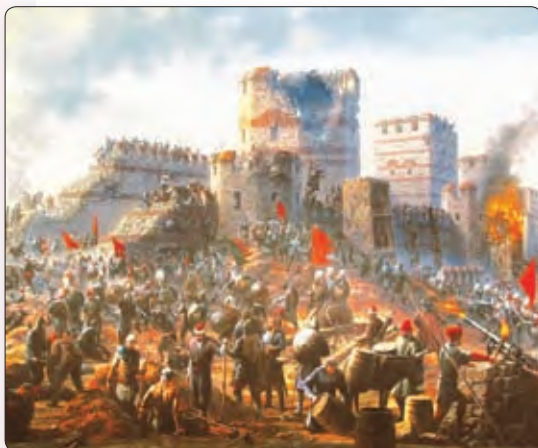
◀ Штурм туркамі Канстанцінопаля. Сучасная карціна

За Іспаніяй прызнаваліся ўладанні ў Амерыцы, за Партугаліяй — у Афрыцы і Індыі.