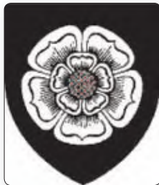
▲ Белая ружа

Гэта азначала рэзкае паслабленне галоўных праціўнікаў каралеўскай улады. Новы кароль Англіі заснаваў дынастыю Цюдараў і ўмацаваў сваю ўладу.