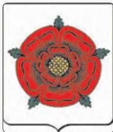
▲ Пунсовая ружа

Вайна расцягнулася на 30 гадоў. Яна прывяла да ўзаема-нага вынішчэння значнай часткі буйных феодалаў Англіі.