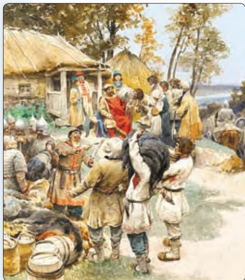
◆ Князь Ігар збірае даніну з драўлян. Мастак К. Лебедзеў

Сын Ігара Святаслаў на працягу свайго праўлення пастаянна вёў войны. Ён разграміў Хазарскі каганат, Балгарыю, распачаў вайну з магутнай Візантыйскай імперыяй. Але візантыйцы ўсё ж такі вымусілі Святаслава пайсці з Балгарыі.