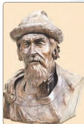
Яраслаў Мудры. Рэканструкцыя М. Герасімава ▶

5. Росквіт Русі. Пасля смерці Уладзіміра паміж яго сынамі пачалася барацьба за ўладу ў Кіеве. Пераможцам у ёй стаў наўгародскі князь Яраслаў , сын полацкай княжны Рагнеды. Падчас праўлення ў Кіеве Яраслава, прызванага Мудрым (1019—1054), Старажытная Русь