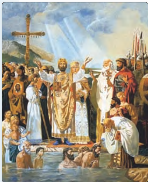
◆ Хрышчэнне Русі. Мастак В. Васняцоў

Князь Уладзімір падпарадкаваў усе ўсходнеславянскія землі Кіеву і знішчыў мясцовых племянных князёў. Замест іх ён прызначаў сваіх пасаdnікаў . Іх памочнікамі былі тысяцкія , якія падчас ваенных дзеянняў узначальвалі апалчэнне («тысячу»). Пазней Уладзімір у найважнейшыя гарады Русі адправіў сваіх сыноў.