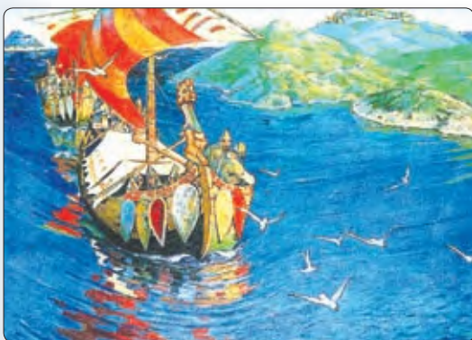
▲ Заморскія госці. Карціна М. Рэрыха

? Знайдзіце на карце 1 (форзац 1) усходнеславянскія саюзы плямён.