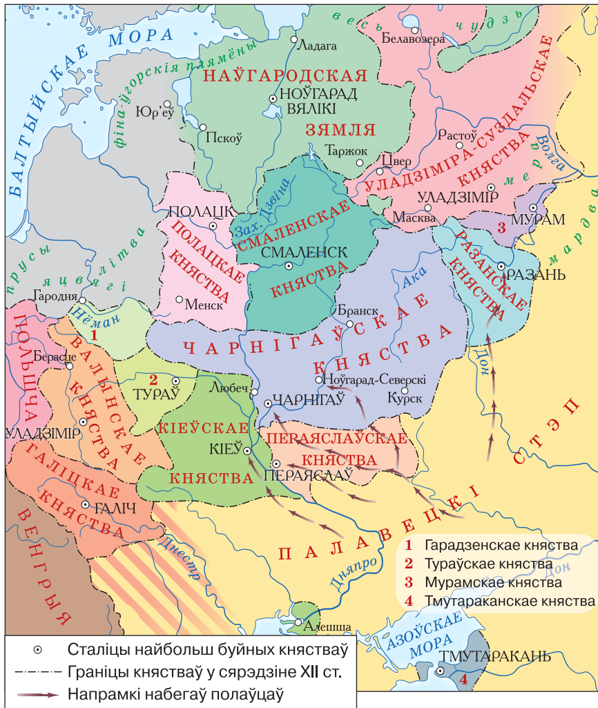
▲ Старажытная Русь у перыяд раздробленасці

2. Найбуйнейшыя княствы. Правіцель, які займаў прас-тол у Кіеве, у летапісах называецца вялікім князем . Усе іншыя князі павінны былі яму падпарадкоўвацца. Аднак ужо ў канцы X ст. самастойным стала Полацкае княства.