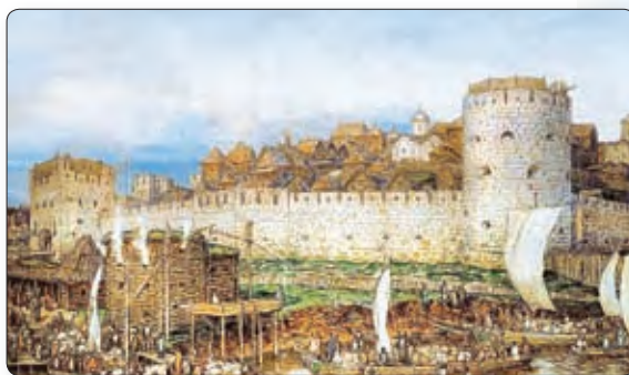
▲ Маскоўскі Крэмель пры Дзмітрыі Данскім. Мастак А. Васняцоў