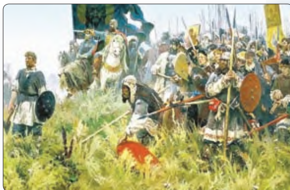
▲ Раніца на Куліковым полі. Мастак А. Бубноў

Аб'яднанне зямель Русі адбывалася ў вострай барацьбе. У другой палове XIV ст. моцным сапернікам Маскоўскага княства стала Вялікае Княства Літоўскае. Яго правіцелі таксама ставілі сваёй мэтай аб'яднанне пад сваёй уладай часткі ўсходнеславянскіх зямель. Барацьба мела пераменны поспех. Тройчы вялікі князь літоўскі Альгерд хадзіў паходамі на Маскоўскае княства, але пакарыць яго не змог.