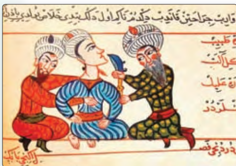
◀ Хірургічная аперацыя. Малюнак XV ст.

Развіццё медыцыны прывяло да адкрыцця бальніц, у якіх працавалі прафесійныя ўрачы. Першая бальніца была адкрыта ў Багдадзе, а неўзабаве іх стала ўжо пяць. Араба-ісламская культура адыграла