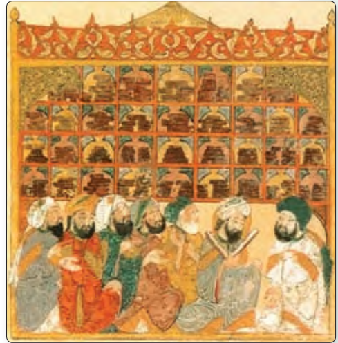
► Дом мудрасці ў Багдадзе. Мініяцюра XV ст.

Знайдзіце на фота мінарэты. Як вы лічыце, чаму так важна было зрабіць іх высокімі?