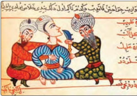
◀ Хірургічная аперацыя. Малюнак XV ст.

Развіццё медыцыны прывяло да адкрыцця бальніц, у якіх працавалі прафесійныя ўрачы. Першая бальніца была адкрыта ў Багдадзе, а неўзабаве іх стала ўжо пяць. Араба-ісламская культура адыграла