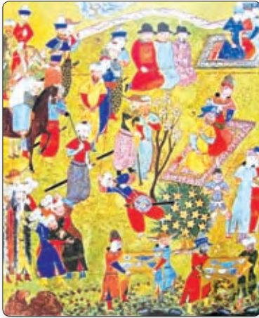
▲ Мініацюра з «Шахнамэ» Фірдаўсі