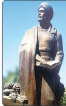
▲ Помнік Амару Хаяму ў Ашхабадзе

«Цар філосафаў Усходу і Захаду» — так называлі сучаснікі іранскага вучонага і паэта Амара Хаяма . І больш за тое, цяжка было знайсці чалавека, роўнага яму па ведах у матэматыцы і астраноміі. Ужо ў 26 гадоў Амар Хайям напісаў працу па алгебры, якая праславіла яго. Ён стварыў новы каляндар, які па дакладнасці пераўзыходзіў усе астатнія. Погляды на жыццё і свет Амар Хайям выклаў у сваіх выдатных вершах, якія і цяпер карыстаюцца вялікай папулярнасцю. У гэтых вершах паэт усхваляў зямное жыццё чалавека.