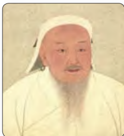
◀ Чынгісхан. Сярэднявечны малюнак

На сваім шляху манголы разбуралі арашальныя збудаванні, знішчалі гарады, бязлітасна забівалі людзей, нават немаўлят, рабавалі тое, што было створана цяжкай працай чалавечых рук. Калі які-небудзь горад доўга не здаваўся, манголы пасля яго захопу ўчынялі «ўсеагульную разню» — забівалі ўсіх жыхароў. Нярэдка мясцовая знаць, ратуючы сваё жыццё і багацці, здавала гарады манголам. Сярэдняя Азія была захоплена манголамі за два гады.