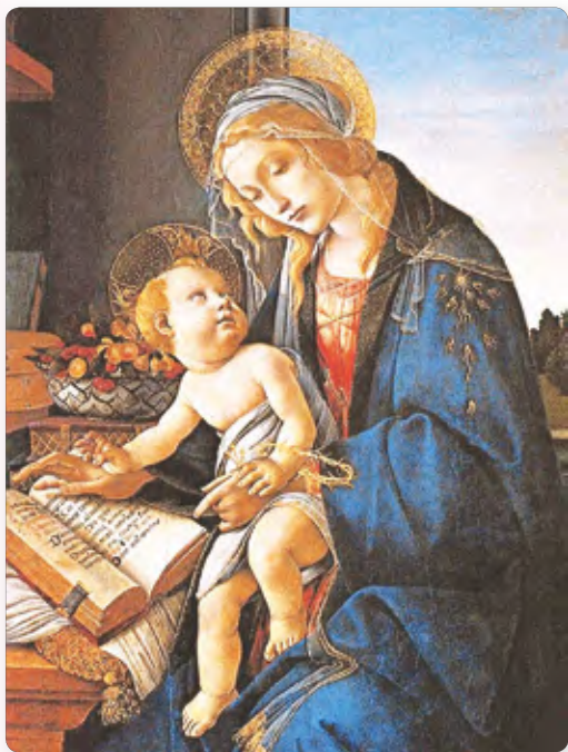
◆ Мадонна с книгой. Художник С. Боттичелли

Человеческие фигуры тоже нарисованы объемно, лица выражают чувства. Появилось стремление и возможность изображать человека, как в жизни. Боттичелли создавал картины уже не только на библейские темы. Он стал писать портреты и картины на сюжеты античной мифологии. Искусство стало уходить от строгости религиозных идеалов, начало отражать сложность человеческих чувств.