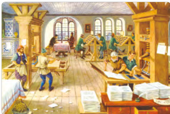
▲ Печатание книг. XV в.