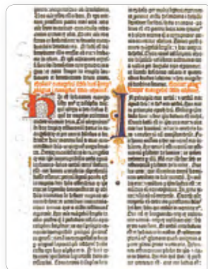
▲ Лист Библии, напечатанной Гутенбергом в 1450 г.

Для печатания Гутенберг приспособил особый станок, который позволял мастеру при помощи винта равномерно прижимать бумагу к набору. В 1445 г. Гутенберг выпустил первую печатную книгу в Европе.