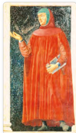
▲ Петрарка. Фреска XV в.

Петрарка считал, что человека делают великим его образованность, занятия наукой, знание истории и культуры человечества. Этого величия каждый человек должен добиваться сам, своим трудом. Он высмеивал роскошь и безделье феодалов. Труды и стихи Петрарки стали широко известны не только в Италии, но и во всей Европе.