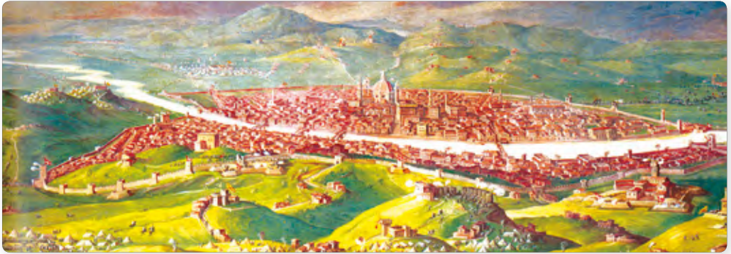
▲ Флоренция. Миниатюра XV в.

необходимы были обширные знания. И не только математики, техники, географии, чужих языков и обычаев. Требовались знания о самом человеке, об устройстве и отношениях между людьми в человеческом обществе.