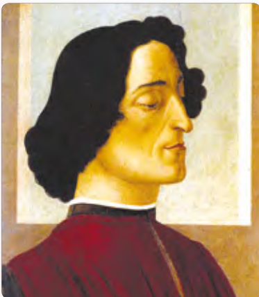
◀ Портрет банкира Джулиано Медичи. С. Боттичелли

Появились и новые взгляды на историю человечества. Некоторые ученые считали феодальные отношения господства-подчинения между людьми примитивными, похожими на поведение зверей в стае. Но какими они должны быть? Идеал общества эти ученые нашли в древних