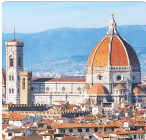
▲ Собор во Флоренции — творение Брунеллески. Современный вид