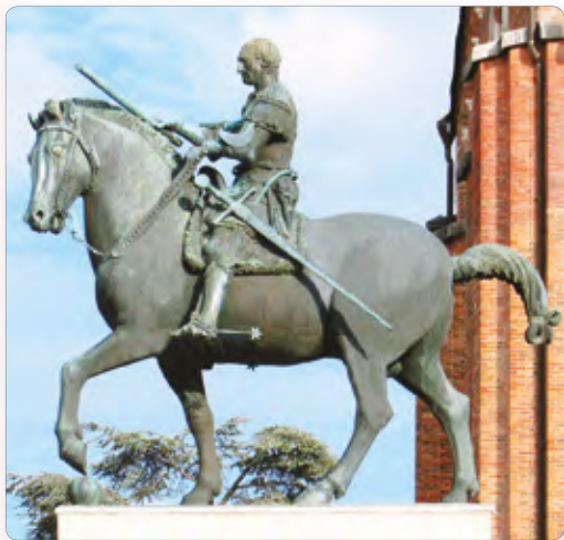
▲ Конная статуя. Скульптор Донателло

Человеческие фигуры тоже нарисованы объемно, лица выражают чувства. Появилось стремление и возможность изображать человека, как в жизни. Боттичелли создавал картины уже не только на библейские темы. Он стал писать портреты и картины на сюжеты античной мифологии. Искусство стало уходить от строгости религиозных идеалов, начало отражать сложность человеческих чувств.