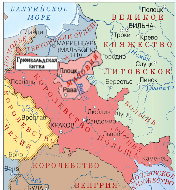
Польша и соседние страны ▶ в начале XV в.

Между тем продолжалась борьба с Тевтонским орденом, который был главным противником