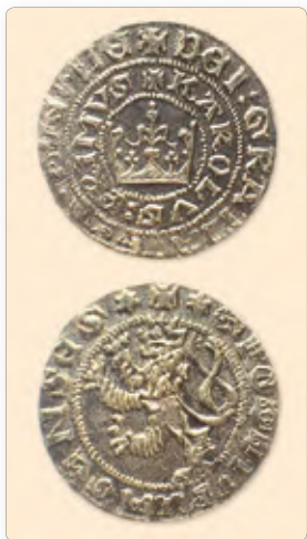
▲ Пражский грош Карла IV

В Позднем средневековье в Чехии быстро росла численность населения, возникло много новых городов. Высокого уровня достигло ремесло. Чешские монеты — серебряные гроши — стали самыми ходовыми деньгами в Центральной Европе, в том числе и на территории Беларуси.