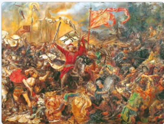
◀ Грюнвальдская битва. Фрагмент картины. Художник Ян Матейко

не только Польши, но и Великого Княжества Литовского . Общая угроза сближала две соседние страны. В результате в 1385 г. в замке Крево (на территории современной Беларуси) между ними была заключена уния.