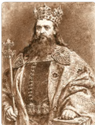
◀ Казимир III Великий. Художник Ян Матейко

3. Становление Польши. В Раннем средневековье славянские племена заселили территорию между реками Одер и Висла. Во второй половине X в. польские земли были объединены в единое государство князем Мешко I . В 966 г. он принял христианство из Рима. Преемник Мешко Болеслав I Храбрый значительно расширил границы своего государства. В 1025 г. незадолго до смерти он получил королевский титул.