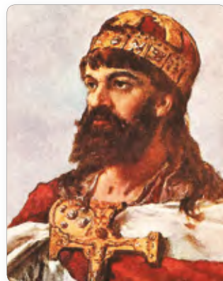
Князь Мешко I.▶ Художник Ян Матейко (XIX в.)

Ожесточенные Гуситские войны длились 15 лет. Они прекратились к 1434 г. , когда паны и богатые горожане пошли на соглашение с императором и папой римским. Повстанцы были разгромлены.