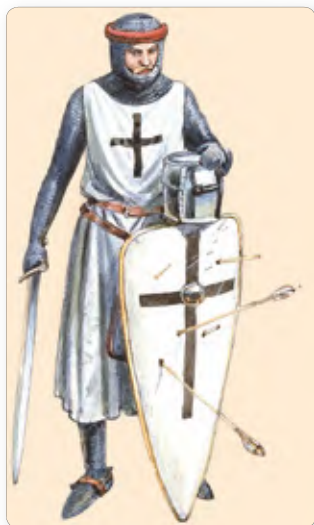
◀ Тевтонский рыцарь. Реконструкция

4. Что представляло собой общество западных славян. На протяжении X—XIII вв. в Чехии и Польше постепенно складывалось феодальное общество. Крестьяне попадали в поземельную и личную зависимость от феодалов. Постепенно, как и на западе Европы, у западных