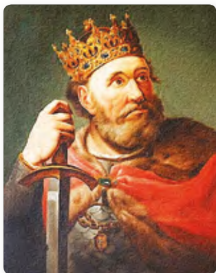
◀ Болеслав I Храбрый. Художник Марчелло Баччарелли (XVIII в.)