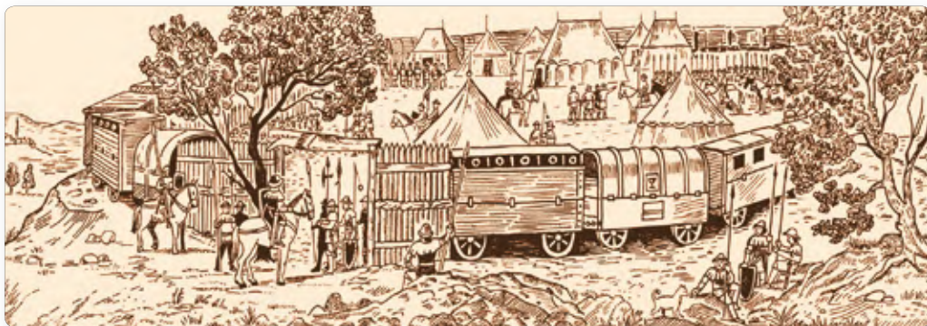
▲ Оборонительное сооружение гуситов. Миниатюра XV в.

2. Кто такие гуситы и чего они добивались. В начале XV в. одним из самых известных и влиятельных людей в Праге стал Ян Гус . Он был избран ректором (руководителем) университета, принял сан священника и начал выступать с проповедями.