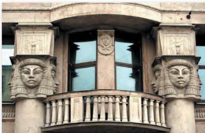
М. Сангайла. Даходны дом А. І. Няжынскай (Егіпецкі дом), Расія (1911–1913)

Да егіпецкай тэматыкі мастакі звярталіся ва ўсе часы. У пачатку XX стагоддзя ў Санкт-Пецярбургу быў пабудаваны дом, які ў народзе прызвалі Егіпецкім. Разгледзьце дэталі фасада будынка. Пeralічыце элементы, якія дазволілі назваць дом менавіта так. Чаму традыцыі старажытнаегіпецкага мастацтва прыцягваюць увагу мастакоў наступных пакаленняў? Прыдумайце свой варыянт выкарыстання старажытнаегіпецкіх матываў у сучаснай архітэктуры Беларусі. Паспрабуйце расказаць пра яго ў даступнай форме (эскізы малюнак, апавяданне).