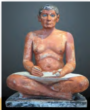
Статуя пісца Kai (III тыс. да н. э.)

Скульптурны партрэт. Пры стварэнні скульптур мастакі таксама прытрымліваліся канона. Для адлюстравання чалавека егіпцяне спецыяльна выбіралі паставы, якія не прадугледжвалі руху. Звычайна гэта сядзячая або стаячая фігура з высунутай наперад левай нагой, абсалютна прамой спінай і амаль поўнай сіметрыяй цела.