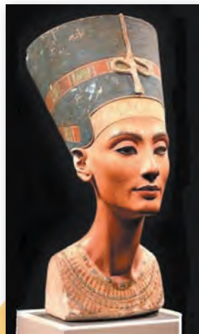
Тутмес. Бюст царыцы Неферціці (XIV ст. да н. э.)

Адным з шэдэўраў старажытнаегіпецкага мастацтва з'яўляецца бюст царыцы Неферціці — жонкі Эхнатона. Прыгажосць гэтай жанчыны ўвекавечыў майстар Тутмес. Ідэальныя рысы яе твару ён удала дапоўніў высокай каронай і масіўнымі каралямі, якія былі ярка распісаны. Такое шматколернае абрамленне падкрэсліла жаночасць і грацыёзнасць царыцы. Строгую веліч аблічча Неферціці змякчыла ледзь прыкметная ўсмешка, якая кранула куткі выдатна акрэсленых вуснаў. А погляд з-пад напаяпушчаных павекаў дадаў вобразу таямнічасці.