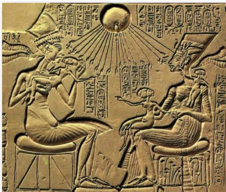
Эхнатон з сям'ёй. Рэльеф (XIV ст. да н. э.)

У гэтым сэнсе асабліва ўражваюць сцэны, якія паказваюць Эхнатона ў коле сям'і — як ласкавага мужа і бацьку. На адным з рэльефаў ахінуты промнямі сонечнага бога Атона ўладар Егіпта трымае на руках і цалуе сваю дачку. Ніколі больш егіпецкія фараоны не адважваліся так адкрыта дэманстраваць у творах мастацтва свае пачуцці.