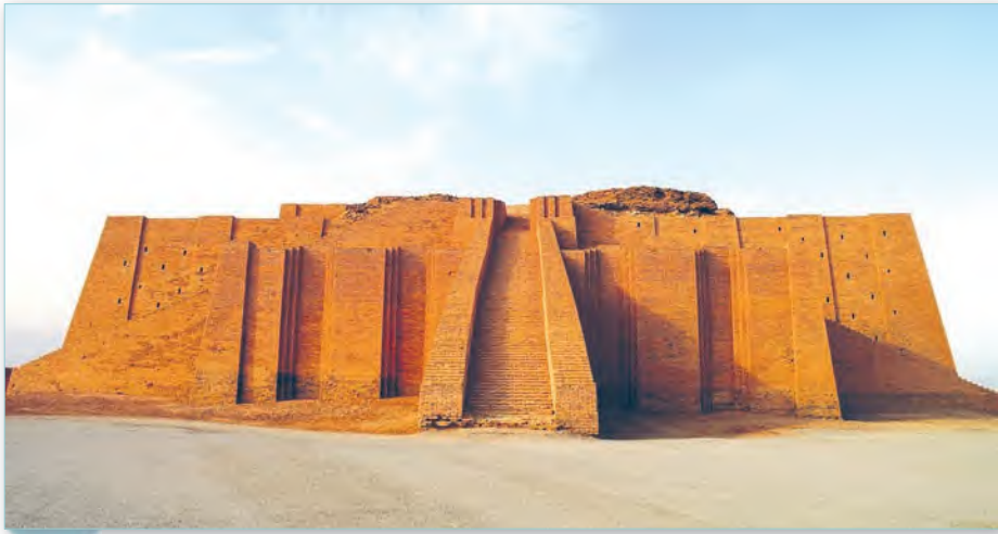
Зікурат у г. Уры. Сучасная рэканструкцыя

На фоне гарадской забудовы зікураты вылучаліся не толькі памерамі, але і колеравым вырашэннем. Платформа пакрывалася чорным бітумам для абароны ад вільгаці. Цэнтральная частка захоўвала чырванаваты колер гліны, а верхняя бялілася вапнай. Сам храм меў нябесна-блакітны колер.