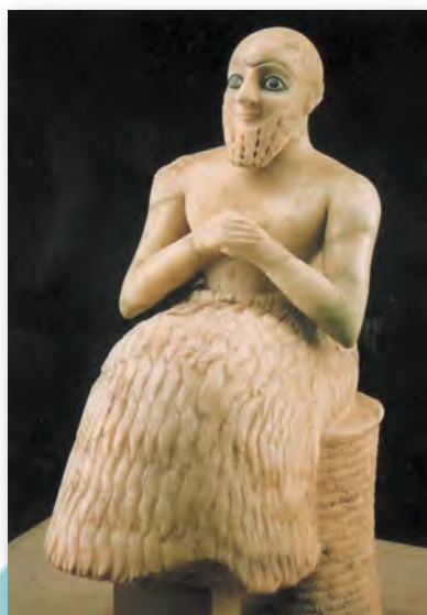
Адарант Эбіх-Іля, вяльможы з г. М'ары (III тыс. да н. э.)