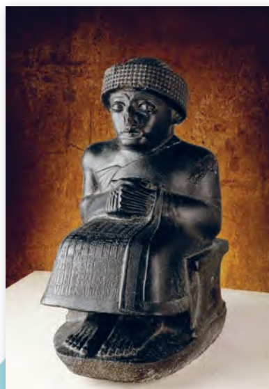
Адарант Гудэа (XXI ст. да н. э.)

рукі і плечы, прапрацаваў пальцы рук і ног, намеціў складкі адзення. У скульптуры Гудэа больш праўдзiва мадэлююцца рысы твару: падкрэслены скулы, падбародак, прапрацаваны бровы.