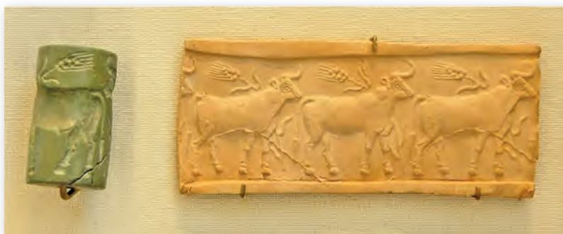
Каменная циліндричная печатка з выявай быка

Выявы быкоў поруч з багамі, царамі і фантастычнымі істотамі часта сустракаюцца і ў гліптыцы — мастацтве разьбы па камені каштоўных парод. Выразаныя на каменных печатках цыліндрычнай формы фігуры гэтых магутных жывёл узяты з міфалагічных сюжэтаў. Пракочваючы цыліндр па мяккай гліне, чалавек назаўжды адлюстроўваў інфармацыю пра ўстойлівыя традыцыі і вераванні шумераў.