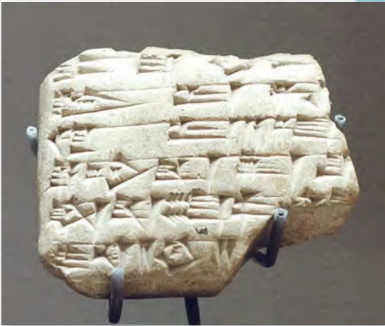
Клінапісная таблічка шумерскага цара Зімы-Ліма (XVIII ст. да н. э.)

Нават пасля таго як краіну шумераў захапілі больш ваяўнічыя суседзі, Гільгамеш застаўся любімым героем народаў Месапатаміі. Як вы думаеце, чаму?