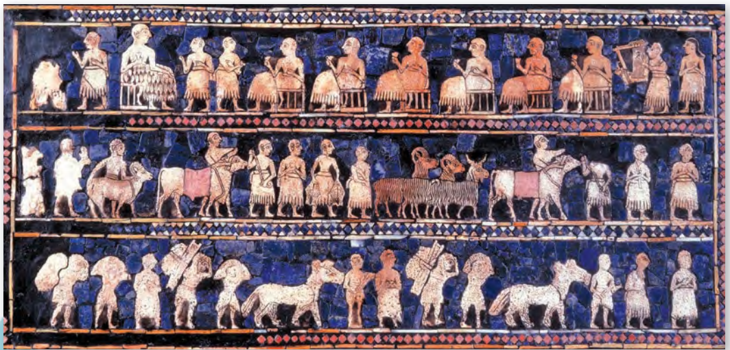
Штандар вайны і міру. Частка «Мір» (каля III–II тыс. да н. э.)

гэтая «гісторыя ў малюнках» усаўляе правіцеля, распавядае нам пра яго ваенныя бітвы і штодзённае жыццё. Фігуры правіцеля, вяль-можаў, воінаў, слуг, музыкаў размешчаны трыма радамі, як радкі ў кнізе.