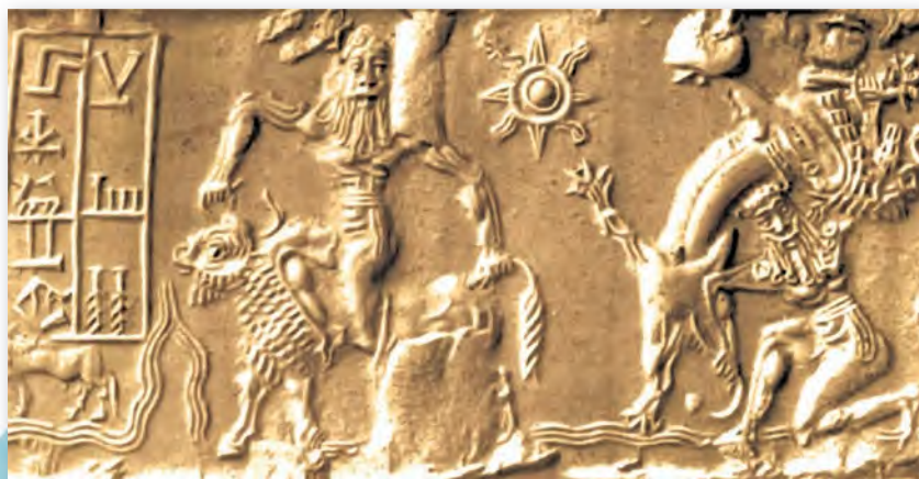
Гільгамеш змагаецца з быком. Адбітак з цыліндрычнай пячаткі (III тыс. да н. э.)

Дзякуючы таблічкам, якія захаваліся да нашых дзён, мы знаёмся і з самай старажытнай на Зямлі паэмай. Гэта « Эпас пра Гільгамэша », прысвечаны подзвігам і прыгодам легендарнага цара горада Урука. Гільгамеш здолеў перамагчы пасланых багамі пачвар, зрабіць цывілізаваным дзікага чалавека Энкіду і пасябраваць з ім. Страціўшы сябра, Гільгамеш (першым у сусветнай літаратуры!) задумваецца аб прыгажосці жыцця і непазбежнасці смерці. Ён адпраўляецца на пошукі неўміручасці, але даведваецца, што сапраўдная неўміручасць чалавека — у яго добрых справах.