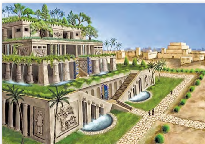
Вісячыя сады Семіраміды. Графічная рэканструкцыя

Храм Мардука, які знаходзіўся на зікураце Этэменанкі, называлі «домам узнятай галавы». Выкажыце свае здагадкі, чаму яго так назвалі. Пацвердзіце іх звесткамі пра памеры вежы.