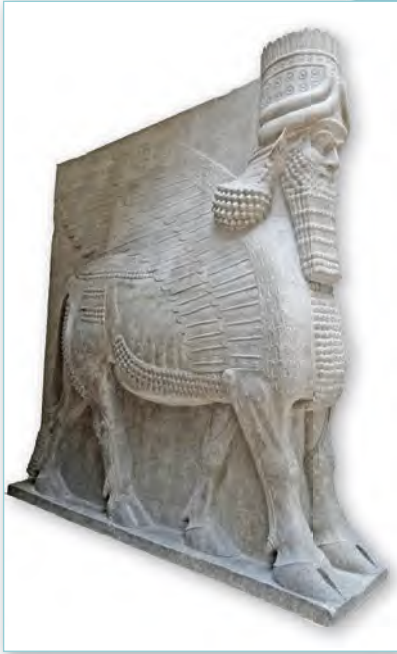
Шэду з Пергамскага музея ў Берліне (IX ст. да н. э.)

У выяўленчым мастацтве асірыйцы надалі ўвагу размаляваным рэльефам. Галоўным сюжэтам групы рэльефаў з выявамі эпизодаў палявання на львоў цара Ашурбаніпала з палаца ў Нінэвіі, як і іншых выяў, стала ўслаўленне цара. Таму нядзіўна, што майстры падкрэслівалі не індывідуальнасць аблічча, а тыя рысы, якія паказвалі на сілу і моц заваёўнікаў. Перададзены драбнюткія асаблівасці касцюма цара, дэтальна прапрацавана мускулатура чалавека і жывёл. Пярэднія лапы льва