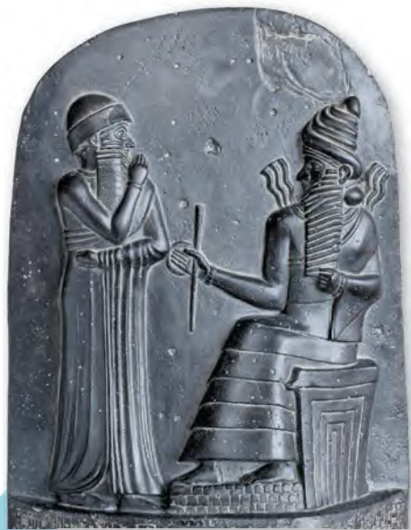
Рэльеф «Цар Хамурапі (злева) і бог сонца Шамаш». Стэла са зводам законаў (XVIII ст. да н. э.)

Па традыцыі шумераў фігуры перададзены абагульнена: галава і ногі паказаны ў профіль, а плечы разгорнуты да глядача. Аднак у гэтай кампазіцыі вызначаецца новая рыса: майстар накіраваў увагу на атрыбуты ўлады і касцюмы персанажаў. Заўважнымі сталі і партрэтныя рысы самога цара: худы твар, высокія скулы, запалыя шчокі.