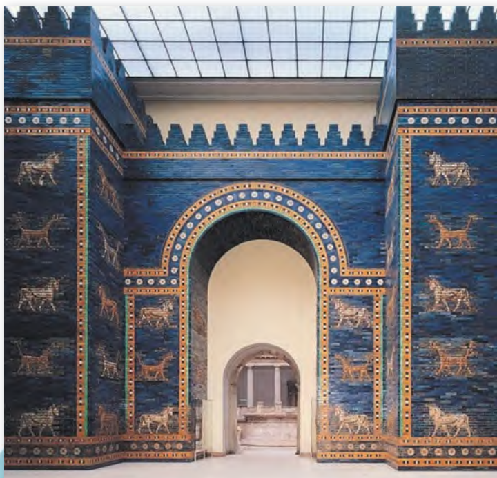
Вароты багіні Іштар (IV ст. да н. э.) у Пергамскім музеі

Да галоўнага храма горада вяла Дарога працэсій , якая ўключала восем святых варот, названых у гонар багоў Месапатаміі. Да нашых дзён захаваліся вароты багіні Іштар — галоўная брама Вавілона.