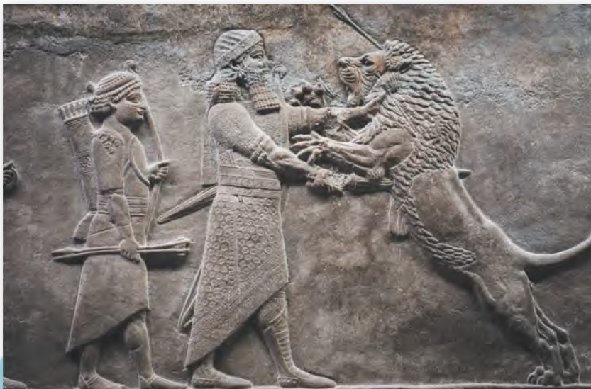
Рэльеф з Ашурбаніпалам, які забівае льва (669 — каля 635 г. да н. э.)

нагадваюць рукі воіна. Ногі да калена і рукі да локця ў цара паказаны аголенымі. Гэта дазваляе ўявіць незвычайную сілу кожнага персанажа.