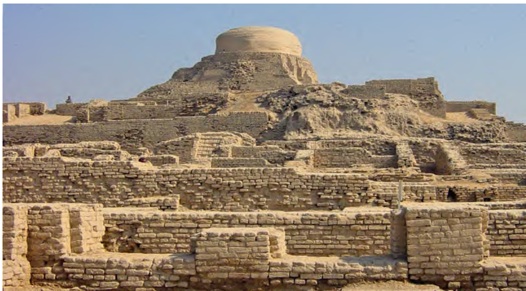
Руіны г. Махенджа-Дара (III тыс. да н. э.)

Росквіт харапскай культуры доўжыўся амаль два тысячагоддзі! Навукоўцы налічылі некалькі дзясяткаў на дзівя аднолькавых гарадоў, са строгай планіроўкай вуліц і дамамі, створанымі, як мы казалі б