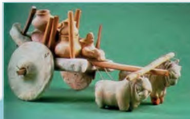
Дзіцячая цацка (III тыс. да н. э.)