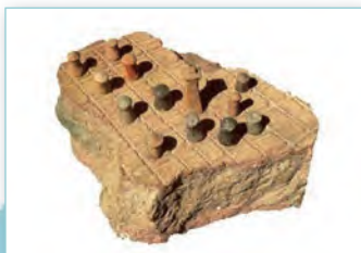
Шахматы (III тыс. да н. э.)