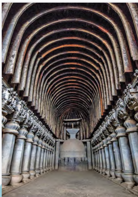
Чайцьця ў г. Карлі (I ст. да н. э.)

Самы вялікі пячорны храм — чайцьця ў горадзе Карлі . Ён размяшчаецца на глыбіні 40 метраў.