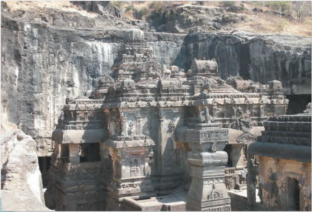
Пячорныя храмы ў Аджанце (II ст. да н. э. — V ст. н. э.)

Унутры — прасторная выцягнутая зала, у завяршэнні якой устаноўлена ступа — як адзін з сімвалаў будыйскай веры. Гэта частка храма, як і алтар хрысціянскіх цэркваў, была найбольш значнай. Унутраныя калоны чайцы ў Карлі маюць падмурак, які нагадвае гліняную пасудзіну. З яго, нібы ствол дрэва, вырастае васьмігранная калона. Завяршае калону форма, якая нагадвае перавернуты звон. На кожнай калоне ўстаноўлены скульптуры сланоў з вершнікамі.