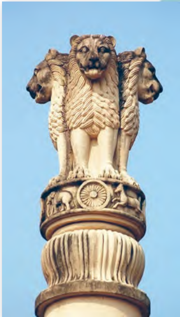
Стамбха правіцеля Ашока (III ст. да н. э.)

Найбольш яркую карціну штодзённага жыцця індыйцаў даюць роспісы старажытных пячорных храмаў Аджанты . Сярод мноства роспісаў, якія пакрываюць сцены пячорных храмаў, мы бачым і сцэны баляванняў, і цырыманіяльныя працэсіі, і малюнкі сланоў, ільвоў,