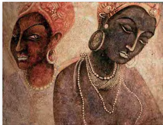
Фрагмент роспісу Аджанты (II ст. да н. э. — V ст. н. э.)