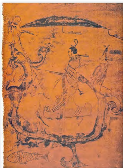
Коннік верхам на цмоку (V–II стст. да н. э.)

З часам асноўнай формай жывапісных палотнаў стаў жывапіс на скрутках . Выкананыя на доўгіх (да 30 метраў) гарызантальных або