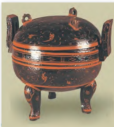
Лакавая пасудзіна з г. Чанша (II ст. да н. э.)