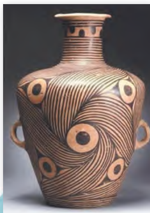
Пасудзіна Яншаа (III–II тыс. да н. э.)