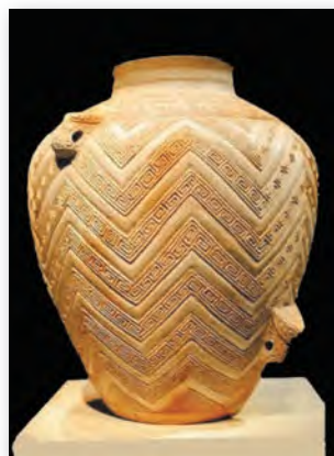
Керамічная пасудзіна з Аньяна (II ст. да н. э.)

сілуэтамі. Гэтыя керамічныя вырабы з чырвонай абпаленай гліны пакрыты разнастайным дэкорам з хвалістых і прамых ліній, зігзагаў, спіраляў, кругоў, ромбаў... Даследчыкі лічаць, што падобныя ўзоры сімвалізавалі прыродныя стыхіі. Радзей сустракаліся схематычныя выявы птушак, рыб, жывёл і чалавека. Вырабляўся такія посуд як уручную, так і на ганчарным крузе. Затым вырабы абпальваліся і паліраваліся да бляску спецыяльнымі прыстасаваннямі. Іх таксама ўпрыгожвалі роспісам.