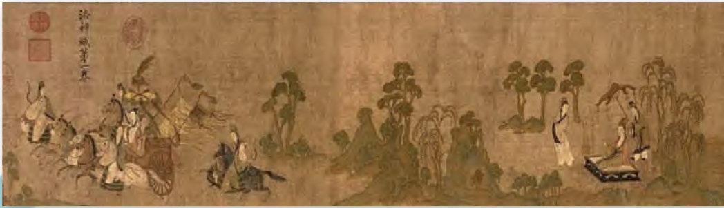
Гу Кайчжы. Фея ракі Ло. Фрагмент (IV ст.)

вертыкальных шаўковых (пазней папяровых) палотнах жывапісныя кампазіцыі зрабіліся асаблівай формай перадачы ўяўленняў аўтараў пра навакольны свет.