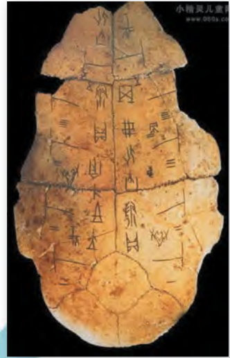
Кітайскія іерогліфы на панцыры чарапахі (II тыс. да н. э.)

Ван Січжы прыпісваюць словы: «Адна рыса не там, дзе трэба, — гэта нібы асілак без рукі». Як вы думаеце, што меў на ўвазе майстар?