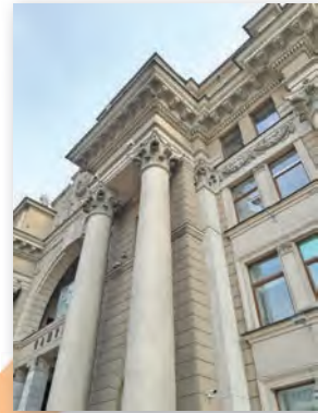
Будынак Галоўпаштамта ў Мінску (1949–1953)

У якіх збудаваннях Беларусі сустракаюцца элементы архітэктурнага ордара? Падрыхтуйце для аднакласнікаў фотавіктарыну з фотафрагментамі архітэктурных збудаванняў Беларусі (вашага рэгіёна, вобласці), у якіх выкарыстаны элементы ордараў.