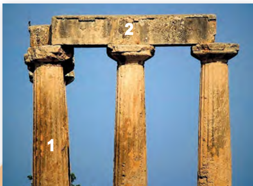
Ордар. 1. Вертыкальная апора (калона). 2. Гарызантальнае перакрыцце (бэлька)

Што такое ордар. У аснову архітэктурнага ордара пакладзена стойкава-бэличная канструкцыя, якая складаецца з вертыкальнай калоны і гарызантальнай бэлькі. Але гэта не звычайная нам канструкцыя. Дойліды асаблівым чынам — пастацку — прапрацавалі кожны элемент, кожную дэталю ордара. Вертыкальная калона — апорная (якая падтрымлівае) канструкцыя, а бэлька — нясучая (якая перакрывае).