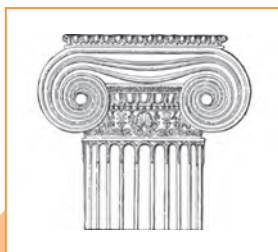
Капітэль іанічнага ордара