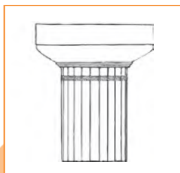
Капітэль дарычнага ордара

Асаблівую прыгажосць і спецыфічны характар архітэктурнаму ордару надавала капітэль . У дарычным ордары яна была без пышнага дэкору. У іанічным ордары капітэль мела два стромкія завіткі, якія па форме нагадвалі кўчары. Капітэль у карынфскім ордары ўражвала наборам дэкаратыўных элементаў: дэталева «вылепленая» лісце ў некалькі радоў, валюты і рэльефныя арнаментальныя палосы.