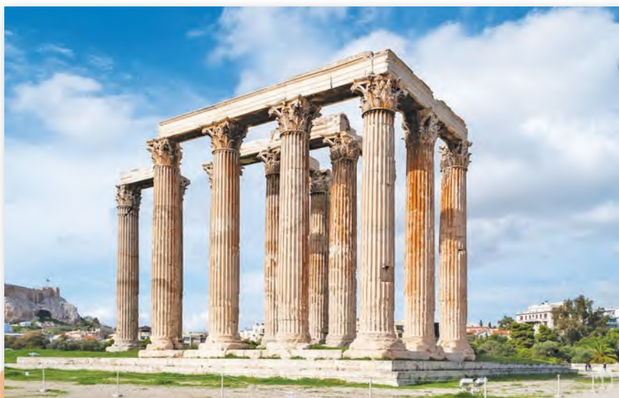
Прыклад карынфскага ордара. Храм Зеўса, Афіны (VI ст. да н. э. — II ст. н. э.)

Карынфскі ордар надае архітэктуры ўрачыста-трыумфальны характар. Таму ён лічыцца эталонам прыгажосці ў еўрапейскім доўлідстве. Карынфскі ордар атрымаў шырокую вядомасць і стаў самым запатрабаваным у наступныя эпохі: у рымскай культуры, культуры эпохі Адраджэння, у мастацтве XIX стагоддзя.