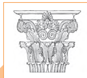
Капітэль карынфскага ордара

Выканайце схематычны малюнак аднаго са старажытнагрэчаскіх ордараў (капітэлі). Пакажыце ў малюнку спецыфічныя асаблівасці ордара (капітэлі).