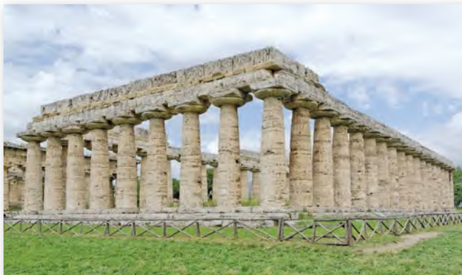
Прыклад дарычнага ордара. Храм Геры I у Пэстуме (VI ст. да н. э.)

Пазней узнік іанічны ордар . Сваю назву ён атрымаў ад плямёнаў іанійцаў, што засялялі адну з абласцей Старажытнай