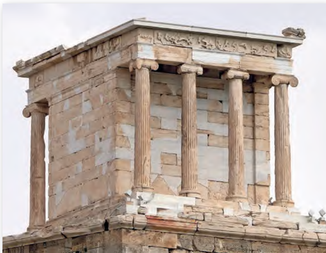
Прыклад іанічнага ордара. Храм Нікі Аптэрас у Афінах (V ст. да н. э.)