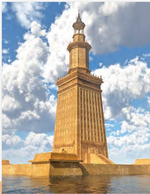
Фараскі маяк (III ст. да н. э.). Графічная рэканструкцыя

Маяк уяўляў сабой збудаванне з трох вежаў, якія стаялі адна на адной. Вежы паступова памяншаліся ўгору. Ніжняя мела чатырохгранную форму, сярэдняя — васьмігранную, верхняя — цыліндрычную. Менавіта ў верхняй вежы пастаянна гарэў агонь. Яго водбліскі на марской вадзе былі бачныя на некалькі дзясяткаў кіламетраў.