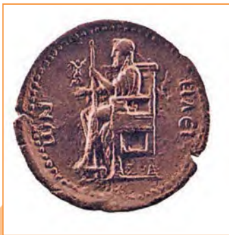
Рымская манета з Эліды з выявай статуі Зеўса Алімпійскага (II ст. да н. э.)

Статуя Зеўса была створана ў V стагоддзі да н. э. у Алімпіі — адным з галоўных культурных цэнтраў Старажытнай Грэцыі. Яе аўтар — самы знакаміты скульптар гэтага часу Фідый . Выкарыстоўваючы розныя матэрыялы — дрэва, слановую косць, золата, — майстар стварыў непаўторны вобраз уладара гэтых мясцін. Статуя была не столькі гіганцкай, колькі стварала ўражанне грандыёзнасці.