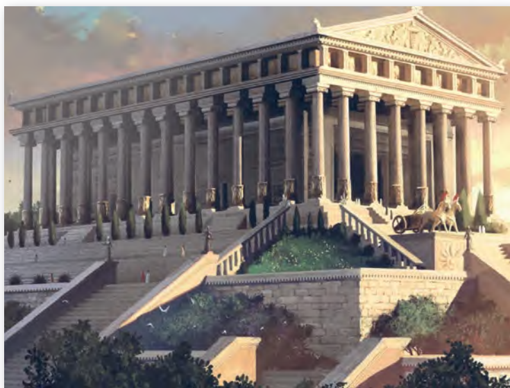
Храм Артэміды ў Эфесе (VI–V стст. да н. э.). Графічная рэканструкцыя

Для ўзвядзення храма была абрана балоцістая мясцовасць. І невыпадкова! Дойліды прадбачылі магчымасць разбурэння такога грандыёзнага збудавання землятрусам. Тэрыторыю асушылі, вырылі катлаван, а падмурак храма дадаткова ўмацавалі.