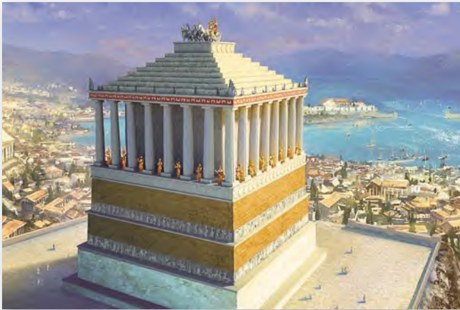
Маўзалеі у Галікарнасе. Архітэктары Піфей і Сатыр (IV ст. да н. э.). Графічная рэканструкцыя

Маўзалеі у Галікарнасе — непаўторнае збудаванне старажытнагрэчаскага мастацтва. Сваю назву ён атрымаў ад імя правіцеля — Маўсола, для якога і пабудавалі грабніцу. Яе ўзвядзенне было распачата яшчэ пры жыцці Маўсола, а завершана яго жонкай — Артэмісіяй.