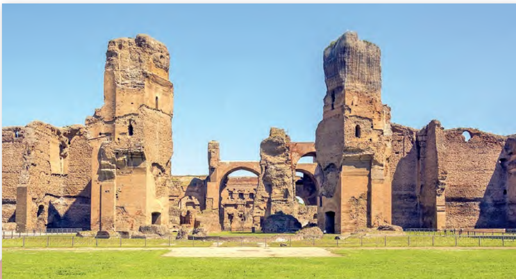
Руіны тэрмаў Каракалы, г. Рым, Італія

У некаторых басейнах была такая гарачая падлога, што людзі заходзілі ў ваду ў скураных сандалях.