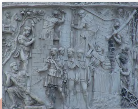
Фрагмент калоны Траяна (II ст.)