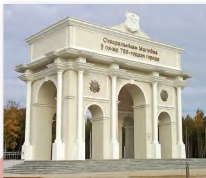
Трыумфальная арка ў Магілёве. Архітэктар В. Рагоўцаў (2017)

Трыумфальная арка ў беларускім горадзе Магілёве адлюстроўвае палітыку дзяржавы па ўвекавечанні гістарычнай памяці. Даведайцеся ў інфармацыйных крыніцах, да якой падзеі было прымеркавана яе будаўніцтва. Назавіце архітэктурна-мастацкія асаблівасці.