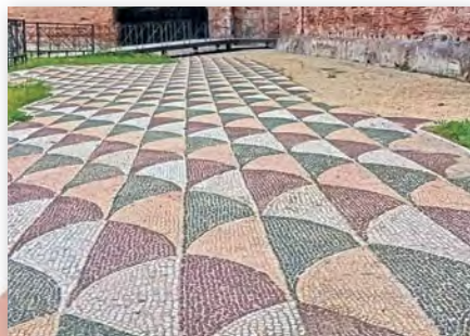
Мазаічная падлога ў тэрмах Каракалы (III ст.)

2. Старажытнарымскі гісторык Светоній пісаў пра рымскага імператара Актавіяна Аўгуста: «Ён так адбудаваў горад, што па праву ганарыўся тым, што прыняў Рым цагляным, а пакідае мармуровым». Патлумачце гэты выраз, выкарыстоўваючы прыклады архітэктурных збудаванняў з параграфа.