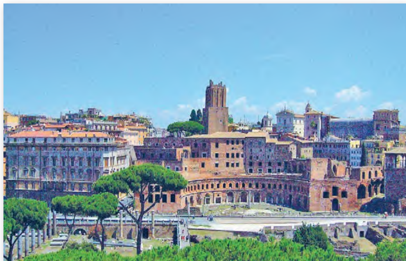
Форум Траяна (II ст.)

Форум імператара Траяна. Апошнім у Рыме было ўзведзена самае значнае і грандыёзнае архітэктурнае збудаванне — форум імператара Траяна . Гэты форум і звязаны з ім пяціпавярховы