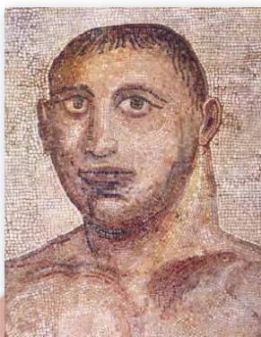
Галава атлета-пераможцы. Фрагмент мазаікі з тэрмаў Каракалы (III ст.)

Прасторныя залы ўпрыгожвалі мазаічныя падлогі, калоны з пышнымі капітэлямі, статуі, фантаны. Да нашага часу тэрмы Каракалы дайшлі ў руінах, аднак і іх маштаб здзіўляе! Больш поўнае ўражанне пра комплекс тэрмаў могуць даць сучасныя рэканструкцыі. А вось захаваныя фрагменты мазаік і статуй распаўядаюць нам пра вытанчанае мастацкае афармленне тэрмаў.