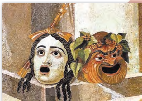
Тэатральныя маскі. Мазаіка з вілы Адрыяна ў Тывалі (II ст. да н. э.)

Важнае значэнне ў рымскім тэатры надавалася знешняму выглядзе персанажаў. Камічныя акцёры апраналі доўгія плашчы, якія спадалі шырокімі складкамі. Маладыя людзі і салдаты насілі кароткія плашчы, што зашпільваліся пры дапамозе шпількі з аднаго боку. Трагічныя акцёры, дэманструючы веліч сваіх персанажаў, выкарыстоўвалі высокія, да 20 см (!), катўрны і больш вялікія парыкі.