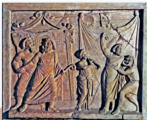
Сцэна з камедыі Тэрэнцыя «Дзяўчына з Андраса». Рэльеф (II ст. да н. э.)

Пазней былі ўзведзены каменныя будынкi — тэатр Пампэя і тэатр Марцэла. Памеры тэатраў рабіліся ўсё больш вялікімі, бо колькасць толькі ўдзельнікаў масавых дзей з часам стала дасягаць 16 тысяч, а глядачоў — 50 тысяч. Гэта былі ўжо асобныя адкрытыя архітэктурныя комплексы — амфітэатры і цыркi, пабудаваныя на роўнай мясцовасці. Глядацкія месцы размяшчаліся вакол арэны-пляцоўкі, пасыпанай пяском і галькай.