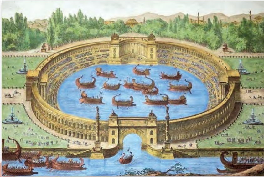
Ж.-Б. Шарпанцье. Марскі бой у рымскім Калізеі

наверх, ператвараючы арэну-пляцоўку ў возера і ствараючы для глядачоў дзіўныя эфекты.