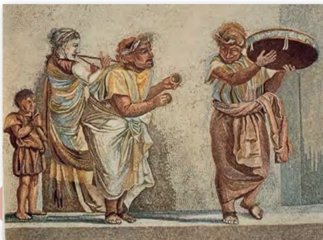
Бадзяжныя музыкі. Мазаіка. Віла Цыцэрона, Пампеі (II ст. да н. э.)

Багатыя грамадзяне трымалі ў сваіх дамах інструментальныя ансамблі або аркестры. Сваіх дзяцей яны навучалі спевам і ігры на музычных інструментах. У Рымскай імперыі была заснавана музычная школа.