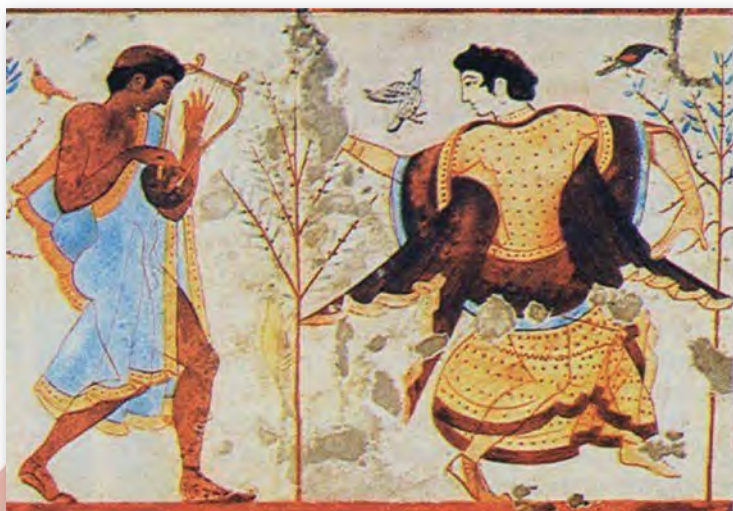
Музыка і танцор. Фрэска з грабніцы Трыклінія, або грабніцы Свята (V ст. да н. э.)

Вытокі старажытнарымскага тэатра. Тэатральныя паказы ў Старажытным Рыме звязаны з вясёлымі сельскімі святамі збору ўраджаю, у час якіх жыхары спявалі гарэзныя жартоўныя песні. А таксама са святкаваннямі і гульнямі, што ладзіліся ў гонар багоў.