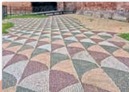
Мозаичный пол в термах Каракаллы (III в.)

2. Древнеримский историк Светоний писал о римском императоре Октавиане Августе: «Он так отстроил город, что по праву гордился тем, что принял Рим кирпичным, а оставляет мраморным». Поясните это выражение, используя примеры архитектурных сооружений из параграфа.