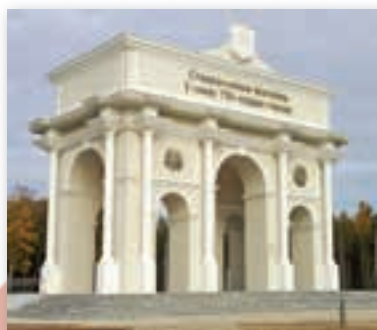
Триумфальная арка в Могилёве. Архитектор В. Роговцев (2017)

Триумфальная арка в белорусском городе Могилёве отражает политику государства по увековечению исторической памяти. Узнайте в информационных источниках, к какому событию было приурочено её строительство. Назовите архитектурно-художественные особенности.