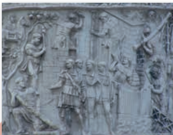
Фрагмент колонны Траяна (II в.)