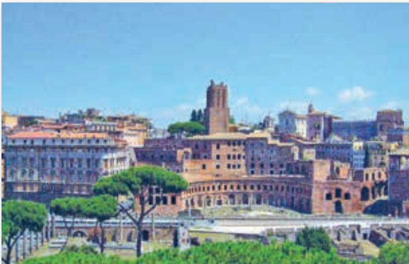
Форум Траяна (II в.)

Форум императора Траяна. Последним в Риме было построено самое значительное и грандиозное архитектурное сооружение — форум императора Траяна . Этот форум и связанный с ним