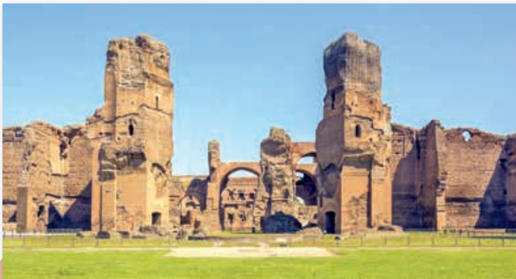
Руины терм Каракаллы, г. Рим, Италия

В некоторых бассейнах был такой горячий пол, что люди заходили в воду в кожаных сандалиях.