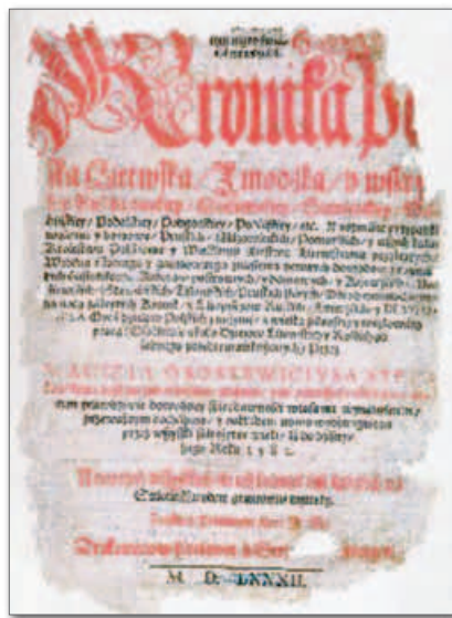
▲ Титульный лист «Хроники польской, литовской, жемайтской и всея Руси» М. Стрыйковского. 1582 г.