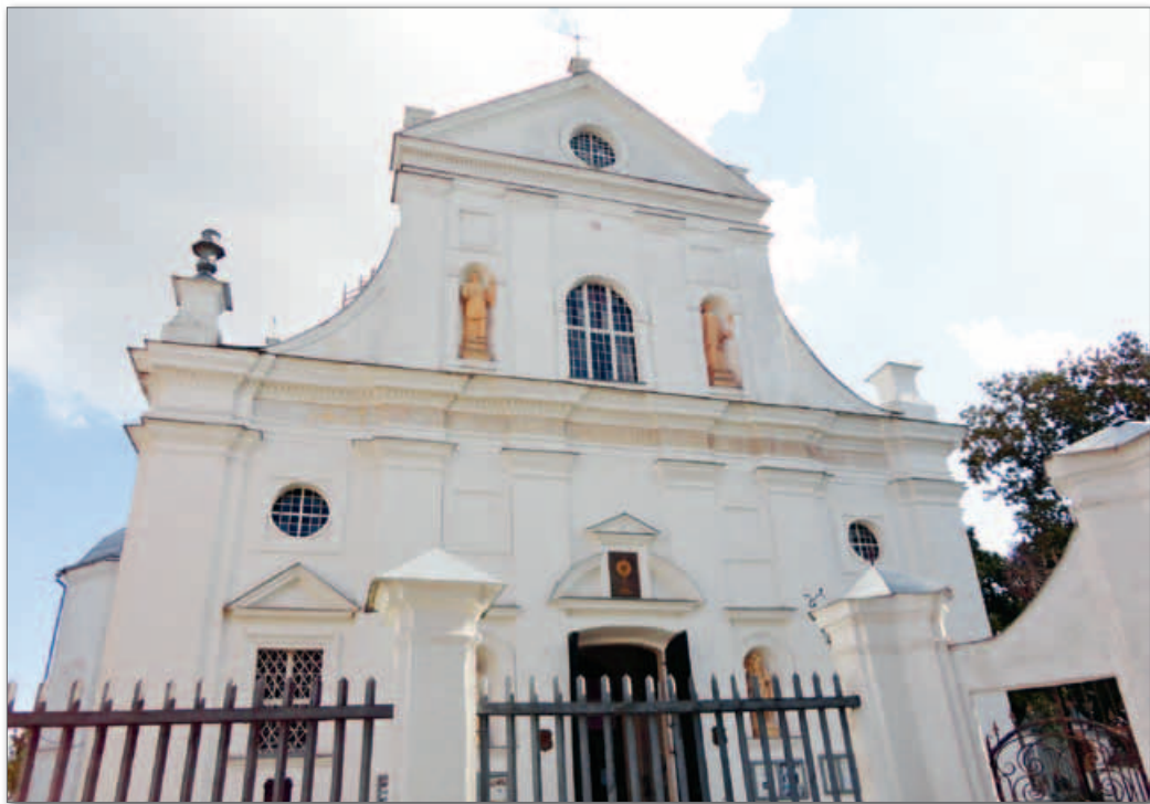
▲ Костел Божьего Тела в Несвиже. Конец XVI в.

С конца XVI — начала XVII в. магнаты и шляхта начали уделять архитектуре большое внимание. Великолепные здания помогали под-