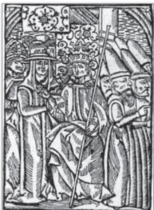
▲ Гравюра начала XVI в. Справа изображены русины

Формы этнического и местного самосознания. Самой важной особенностью формирования того или иного народа является этническое (национальное) самосознание. Иначе говоря, человек принадлежит к тому народу, к которому он сам себя причисляет. В XIV—XVI вв. бóльшая часть жителей современной Беларуси называла себя «русь», «русины». Только на северо-западе, где проживало немало балтов, были распространены также самоназвания «литва», «литвин». Но за пределами Великого Княжества Литовского всех его жителей нередко называли литвинами. Это было связано с тем, что слово «Литовское» стояло на первом месте в названии государства.