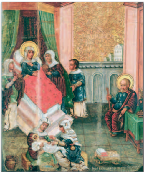
◀ Рождество Богородицы. Художник Петр Евсеевич из Голынца. 1649 г.