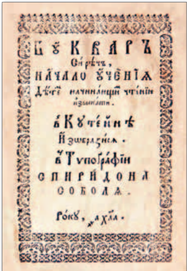
◀ Титульный лист «Букваря» С. Соболя

Православные и братские печатники преимущественно осуществляли выпуск необходимой для обучения литературы. В 1569 г. в Заблудове (сейчас территория Польши) Иван Федоров и Петр Мстиславец издали «Евангелие учительное». В середине 1570-х гг. П. Мстиславец