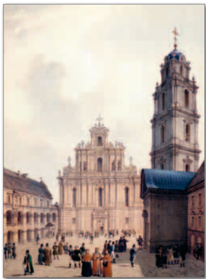
▲ Главный двор Виленской академии. Рисунки XIX в.

Развитие системы образования способствовало развитию гуманитарных наук. Распространялись знания о ВКЛ и белорусских землях за пределами государства. Этому способствовали образовательные путешествия молодых шляхтичей по странам Западной Европы, создание произведений по истории страны. Среди них следует отметить хроники Матея Стрыйковского и Александра Гваньини, первую точную карту ВКЛ Томаша Маковского (1603).