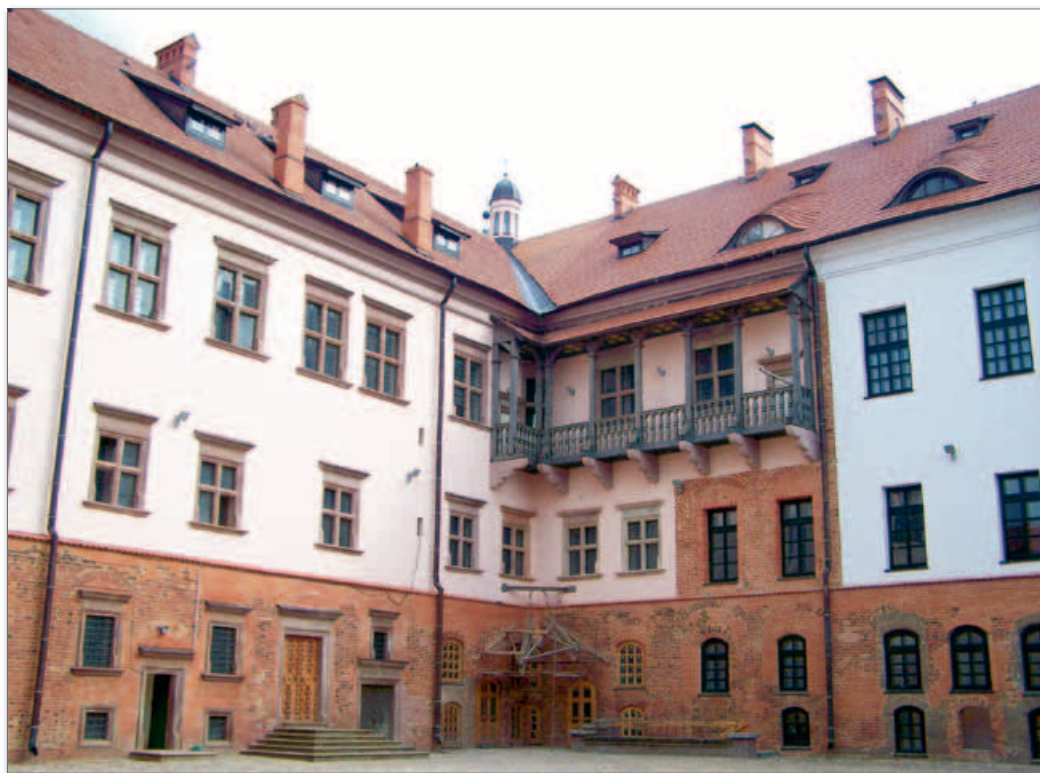
▲ Мирский зámок. Дворец. Конец XVI в.

черкнуть влияние их родов. Наряду с деревянными зámками стали появляться каменные дворцы, окруженные садами и защищенные валами. Они сочетали элементы различных западноевропейских стилей (готики, позднего Ренессанса и барокко) с традициями местного зодчества. Наиболее ярко это проявилось в дворцово-парковом комплексе в Несвиже, в зámках в Мире, Гольшанах, Смольянах и Любче.