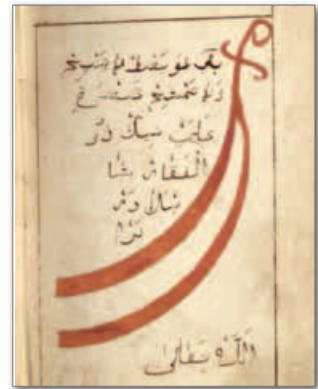
▲ Страница книги «Хамаил». Старобелорусский язык, переданный арабским письмом

Старобелорусский язык достиг высокого уровня развития. Он имел очень богатый и разнообразный запас слов, касающихся самых разных сфер жизни. Этот запас постоянно пополнялся, в том числе за счет иноязычных