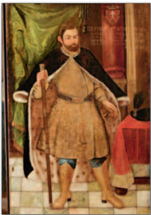
◀ Криштоф Веселовский. Неизвестный художник. Начало XVII в.

Среди шляхты стало модным собирать галереи портретов знаменитых предков и государственных деятелей. Самые большие собрания были у Радзивиллов в Несвиже, Вильно, Слуцке, у Сапег в Кодени (ныне территория Польши). Дворцы, шляхетские усадьбы и мещанские дома украшали витражи, гобелены, оружие и посуда.