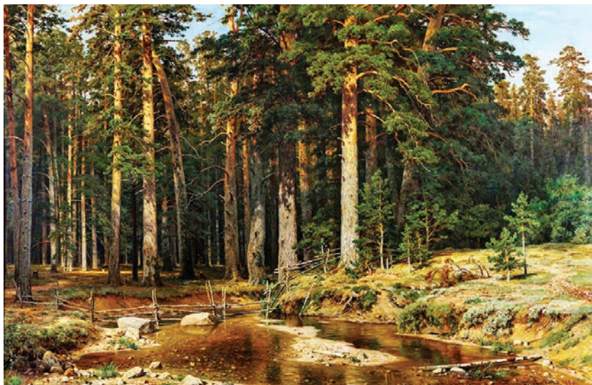
И. И. Шишкин. Корабельная роща

Вдаль уходит пространство бора, окутанное тёплым светом. Верхушки деревьев срезаны, и поэтому создаётся ощущение, будто они не помещаются на холсте. Очень красиво прописан ручей с лёгким отражением стволов деревьев в воде. Слева — переброшенная через ручеёк изгородь, свидетельство близкого присутствия человека. Справа — две небольшие ёлочки, говорящие о начале новой жизни. Этот холст необходимо рассматривать медленно, чтобы почувствовать, насколько пушист мох, как жгуче палит солнце, как горячо земле от зноя. Кое-где трава на поляне побурела.