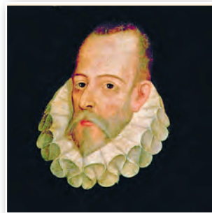
Мігель дэ Сервантэс Сааведра. Мастак Хуан дэ Хаурэгі. 1600 г.

У выніку імя Дон Кіхота стала намінальным. І ў наш час адарваных