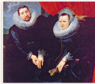
Партрэт шлюбнай пары. Мастак Антоніс ван Дэйк . 1618 г.

Аксэсуарам багатых людзей лічыўся белы шырокі каўнер, які шчыльна прылягаў да шыі. Такі каўнер бярэ свой пачатак у іспанскай модзе XVI ст. Яго шылі з вельмі тонкага палатна, затым рабілі складкі і моцна крухмалілі, а часам насаджвалі на драцяны каркас для шчыльнасці. Імкненне прадстаўнікоў шляхты падкрэсліць сваю перавагу вяло да павелічэння памераў каўняра, які стаў такім велізарным, што атрымаў назву «млынавыя жорны».