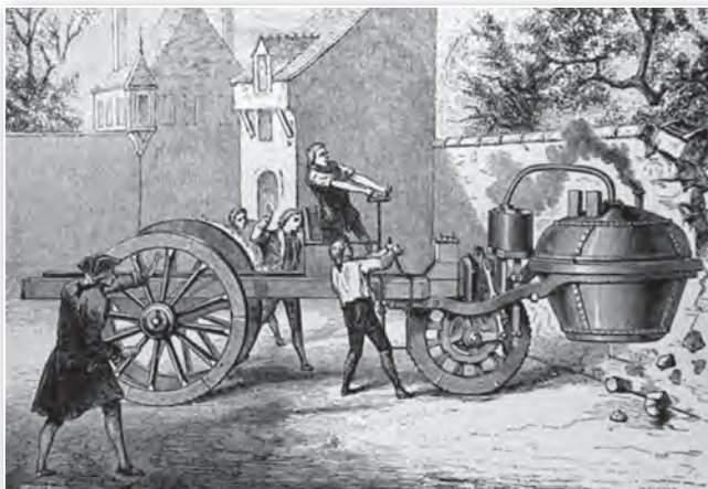
Адна з першых машын (павозка) з паравым рухавіком. XVIII ст.

паравой машыны. Прымяненне паравога рухавіка ў прамысловасці пры- вело да рэзкага росту прадукцыйнасці працы.