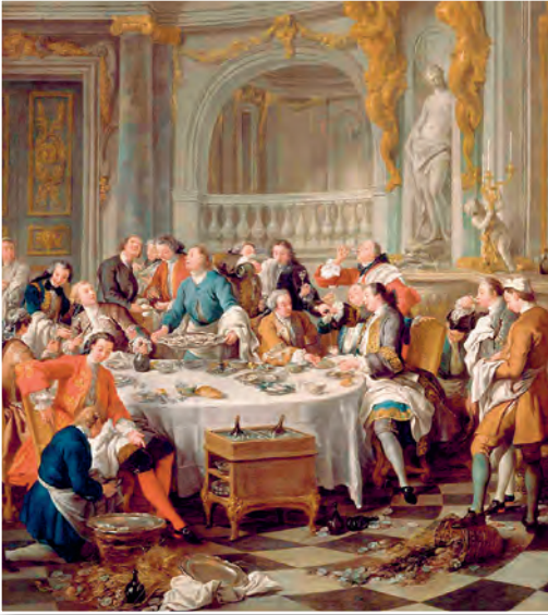
Абед з вустрыцамі. Мастак Жан-Франсуа дэ Труа. 1735 г.