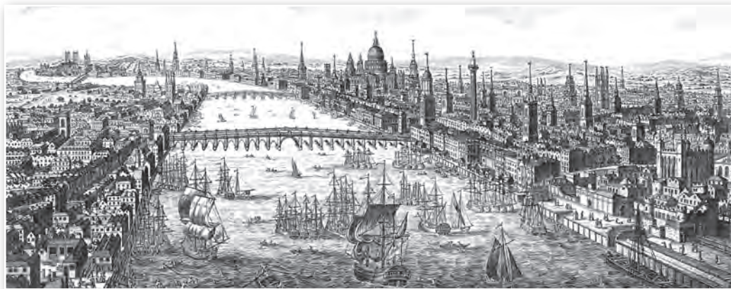
Агульны выгляд Лондана. Мастак Томас Боўлз . 1751 г.

Якія дэталі карціны паказваюць на тое, што на ёй адлюстраваны горад Новага часу?