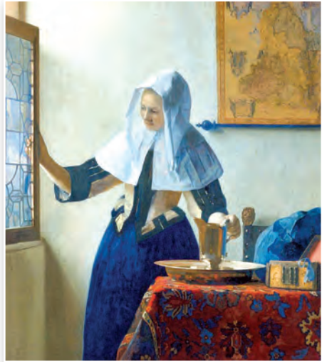
Маладая жанчына са збаном вады. Мастак Ян Вермеер. 1660–1662 гг.

3. Жыццё ў вёсцы. Сельскія дамы на поўначы Еўропы будавалі з дрэва, на поўдні — з каменю. Дах крылі саломай або трыснягом. У галодныя гады такое пакрыццё часта ішло на корм жывёле. Сялянскі