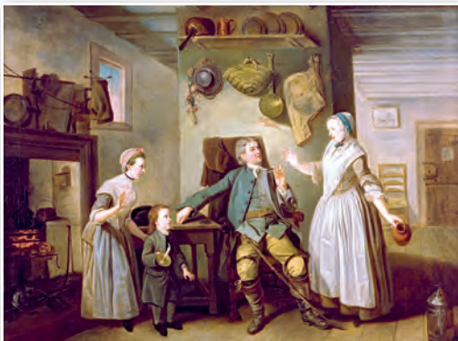
Вяртанне фермера. Мастак Ёган Цофані. 1762 г.

У Еўропе XVI–XVIII стст. па вопратцы лёгка было адрозніць двараніна і простага чалавека. Нават багатым гараджанам забаранялася апранацца так, як апраналіся прадстаўнікі знаці. У спецыяльным указе імператара Карла V ад 1543 г. гаварылася, што адзенне павінна дапамагаць адрозніць «князя ад графа,