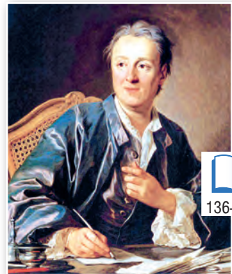
Дэні Дзідро. Мастак Луі Мішэль ван Лао . 1767 г.