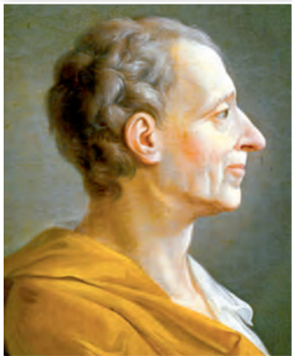
Шарль Луі Мантэск'ё. Невядомы мастак. 1728 г.

Лок быў заснавальнікам вучэння пра падзел улад. Згодна з ім заканадаўчая ўлада, якая прымае законы, павінна належаць дэпутатам, якія выбіраюцца народам. Выканаўчая ўлада, якая праводзіць законы ў жыццё, даручаецца манарху і яго ўраду. Такім чынам, Лок быў прыхільнікам канстытуцыйнай манархіі , гэта значыць такой формы кіравання, пры якой улада караля абмяжоўваецца канстытуцыяй . Менавіта такая манархія ўсталявалася ў Англіі ў выніку рэвалюцыі XVII ст.