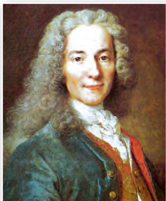
Вальтэр. Мастак Нікала дэ Ларжыльер. 1718 г.

3. Французскае Асветніцтва. Французскае Асветніцтва, у адрозненне ад англійскага, характарызавалася бязлітаснай крытыкай царквы, старадаўніх звычаяў і абсалютнай манархіі. Выбітнымі французскімі асветнікамі былі Шарль Луі Мантэск'ё, Вальтэр і Жан-Жак Русо. Шарль Луі Мантэск'ё (1689–1755) развіў ідэі Лока, у прыватнасці тэорыю пра падзел улад. Згодна з ім заканадаўчая ўлада павінна належаць народу ў асобе абраных дэпутатаў-заканадаўцаў, выканаўчая — каралю і яго ўраду, а судовая — незалежнаму саслоўю судзяў. Усе тры ўлады павінны быць незалежныя адна ад адной.