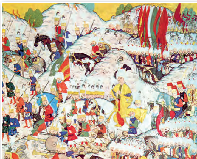
Султан Сулейман I Пышны ў бітве пры Мохачы (фрагмент). Турэцкая мініяцюра XVI ст.

2. Славакія. Славацкія землі здаўна знаходзіліся ў складзе Венгерскага каралеўства. Аднак у 1526 г. венгерскія войскі пацярпелі паражэнне ад туркаў-асманаў у бітве пры Мохачы. У выніку адбыўся