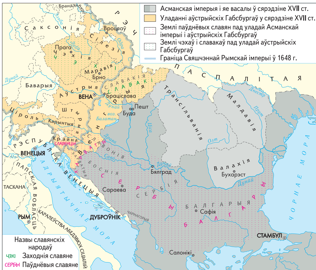
Землі заходніх і паўднёвых славян у сярэдзіне XVII ст.

Вызначце, у склад якіх дзяржаў уваходзілі землі паўднёвых славян у XVI ст.