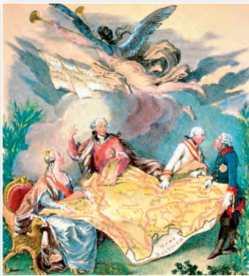
Падзел «польскага пірага». Карыкатура XVIII ст.

У 1569 г. Польшча і Вялікае Княства Літоўскае стварылі аб'яднаную дзяржаву — Рэч Паспалітую — шматнацыянальную дзяржаву, у склад якой уваходзілі беларускія, польскія, літоўскія і ўкраінскія землі. У XVII ст. у Рэчы Паспалітай нарасталі рэлігій-