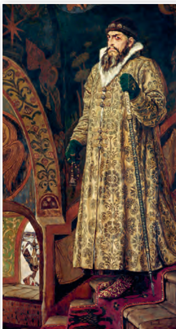
Цар Іван IV Грозны. Мастак Віктар Васняцоў. 1897 г.

Паразважайце, ці можна Земскі сабор у Расіі назваць саслоўна-прадстаўнічым органам. Прывядзіце два аргументы на карысць вашай высновы.