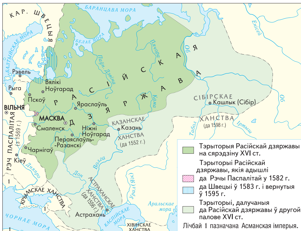
Расійская дзяржава ў другой палове XVI ст.

Знайдзіце на картасхеме тэрыторыю Расійскай дзяржавы ў сярэдзіне і ў канцы XVI ст. З апораў на картасхему высветліце, якія землі ўвайшлі ў склад Расіі да канца XVI ст., а якія да гэтага ж часу былі страчаны.