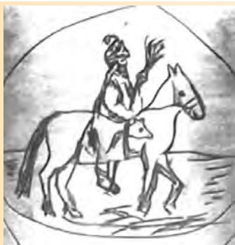
Апырчнік. Павялічаны малянак з паддона падсвечніка пачатку XVII ст.