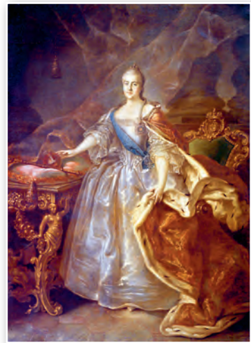
Партрэт Кацярыны II. Мастак Іван Аргуноў. 1762 г.

2. Прыход да ўлады Кацярыны II. Становішча стабілізавалася ў эпоху кіравання Кацярыны II , якая правіла ў 1762—1796 гг. Яна атрымала карону дакладна гэтак жа, як і яе папярэднікі, — у выніку палацавага перавароту.