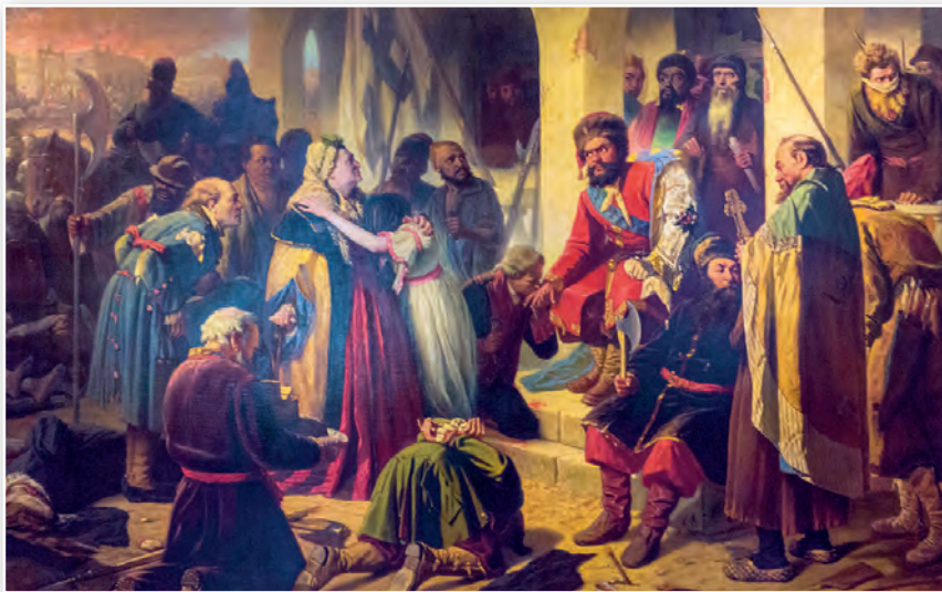
Суд Пугачова. Мастак Васіль Пяроў. 1879 г.

Як вы лічыце, над кім чыніць суд Емяльян Пугачоў?