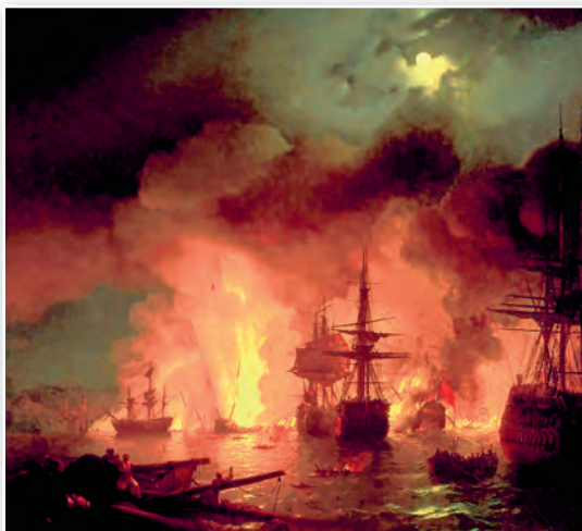
Чэсменскі бой 25–26 чэрвеня 1770 г. Мастак Іван Айвазоўскі. 1848 г.