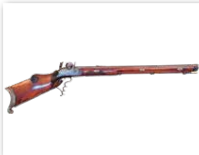
Мушкет — ручное огнестрельное оружие в XVI—XVII вв.