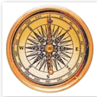
Компас — прибор для определения сторон света

1. Причины и начало Великих географических открытий. Каковы же были причины Великих географических открытий ? Существовало несколько причин, которые обусловили эти смелые и грандиозные предприятия.