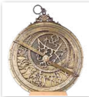
Астролябия — прибор, с помощью которого моряки определяли свое местонахождение в океане