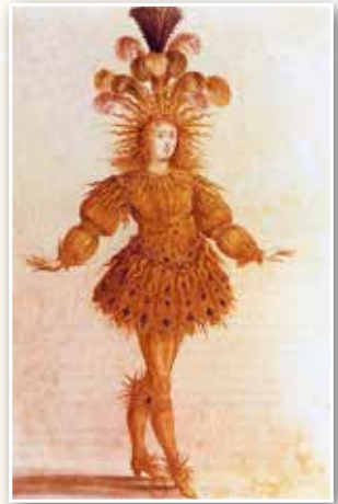
Людовик XIV в костюме «Солнце». 1653 г.

Объясните, почему Людовика XIV прозвали «король-солнце». Соответствовал ли французский король этому прозвищу? Поясните свою точку зрения.