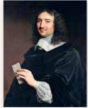
Жан-Батист Кольбер. Художник Филипп де Шампань. 1655 г.

Он хотел обеспечить Франции экономическое могущество в Европе. Поэтому французское правительство поддерживало развитие мануфактур: оказывало им всевозможную помощь и предоставляло льготы, стремилось защитить от иностранной конкуренции, вводя высокие пошлины на товары, ввозимые из-за границы.