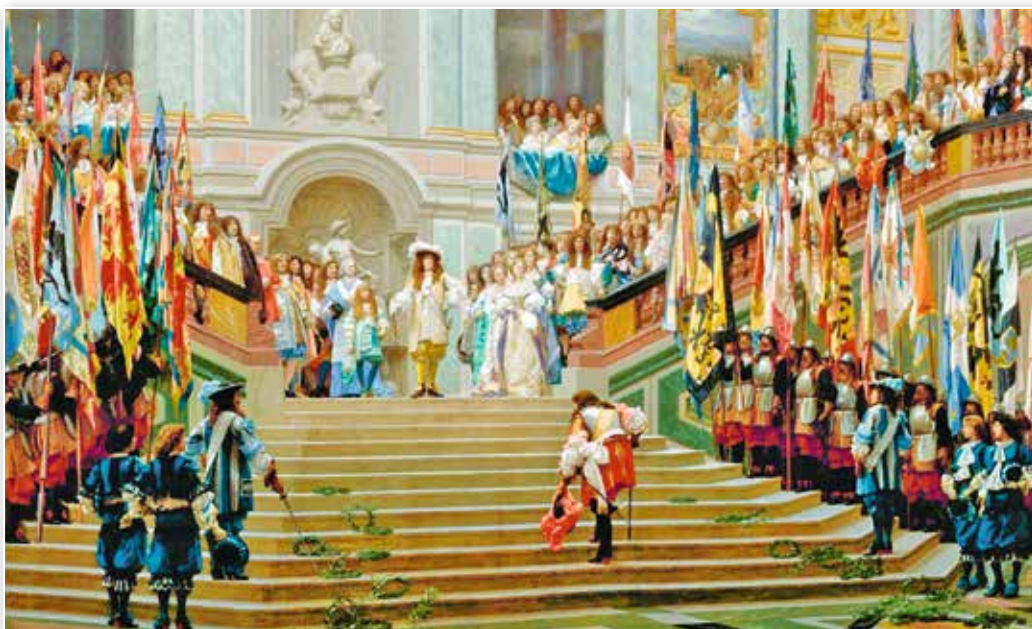
Прием принца Конде Людовиком XIV в Версале. Художник Жан-Леон Жером. 1878 г.

Каким образом художник подчеркнул величие и власть Людовика XIV?