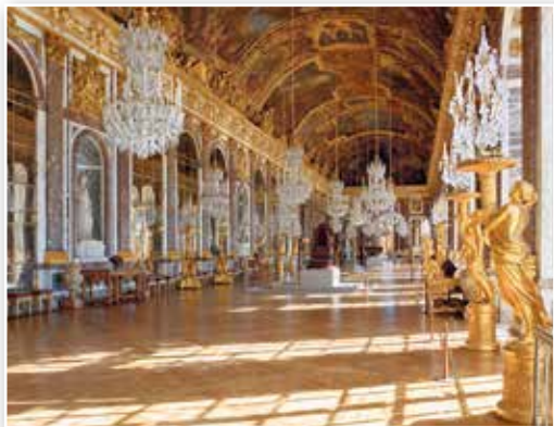
Версаль. Зеркальная галерея

«Государство — это я». Король, как и его предшественники, управлял страной без парламента. Генеральные штаты не собирались во Франции с 1614 до 1789 г.