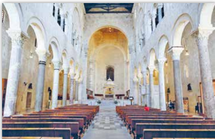
Цэнтральны неф у саборы Сан-Сабіна ў Бары, Італія (XII—XIII стст.)

Раманскі базілікальны храм меў свае асаблівасці. Для яго была характэрна форма выцягнутага лацінскага крыжа, які адлюстроўваў ідэю крыжовага шляху Хрыста. З часам гэтая ідэя ў сярэднявечковай культуры стала цэнтральнай і атрымала асэнсаванне ва ўсіх відах мастацтва.