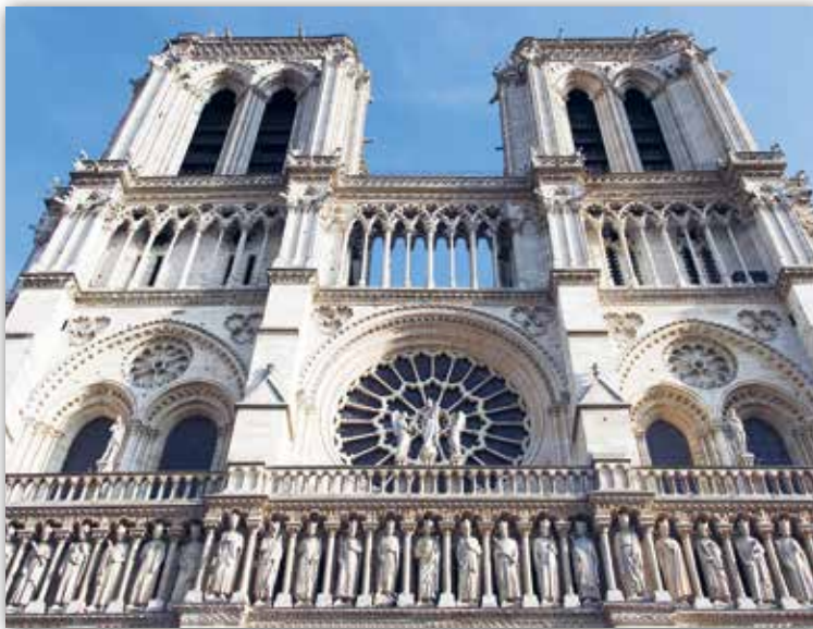
Матыў кветкі ружы ва ўбранні заходняга фасада сабора Нотр-Дам у Парыжы, Францыя (XII—XIV стст.)

Гатычныя вокны. Адным з прыёмаў палягчэння сценаў было прымяненне вялікіх акон. Форма акон і праёмаў у параўнанні з раманскай архітэктурай стала зусім іншай. Яна атрымала стральчатыя контуры , якія нагадваюць вастрэё