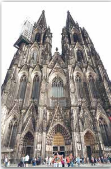
Кельнскі сабор, Германія (XIII—XIX стст.)

Накіраваны ўвысь, нібы сатканы з павуцінныя каменных «нітак» кафедральны сабор займаў цэнтральнае месца ў сярэднявечным горадзе. У параўнанні з раманскімі храмамі яго ўнутраная прастора была павялічана: вышыня сабораў часам перавышала 40 метраў, а даўжыня была больш за 100 метраў. Гэта патрабавала змяненняў у іх канструкцыі, і замест грузных каменных сценаў раманскіх храмаў з’явілася каркасная сістэма . Яна прадугледжвала наяўнасць апор — калон або слупоў, на якія абапіралася перакрыцце — скляпенне.