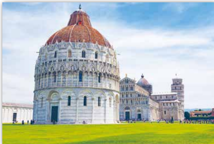
Архітэктурны ансамбль у Пізе, Італія (XI—XIII стст.)

У раманскай архітэктуры шырока выкарыстоўвалася арачная форма . Па сваім абрысе яна была паўкруглай. Аркі, нішы і аркадныя галерэі рознага маштабу аблягчалі цяжкавагавыя сцены, а таксама служылі аздабленнем