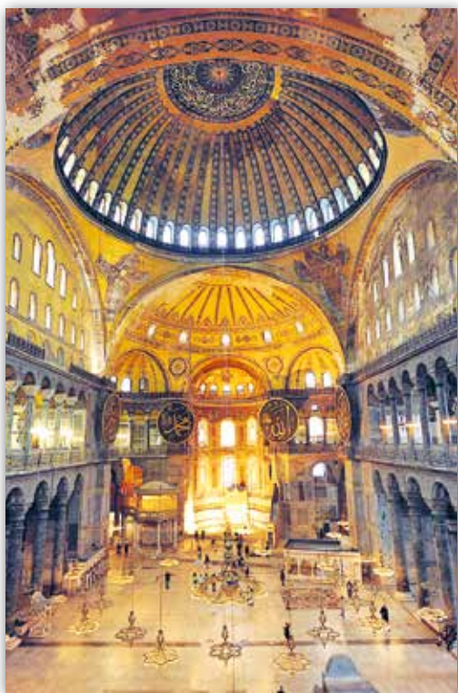
Інтэр'ер сабора Святой Сафіі ў Канстанцінопалі (сучасны Стамбул), Турцыя (VI ст.)

расхінутай унутранай прасторай, напоўненай святлом. У адрозненне ад цяжкага маналітнага купала Пантэона, які абаліраецца на тоўстыя сцены, купал сабора Святой Сафіі, здаецца, луннае ў паветры. Яго падмурак прарэзаны радам акон, якія ўпускаюць у храм шмат святла. Гэта не выпадкова — у хрысціянстве святло з'яўляецца адным з сімвалаў Бога. Прастора паміж вокнамі настолькі вузкая, што ў промнях сонца робіцца непрыкметнай. Ствараецца ўражанне, што купал ні на чым не трымаецца, а чудоўным чынам вісіць сам па сабе, абаліраючыся толькі на кальцо Боскага святла. Здзіўленыя