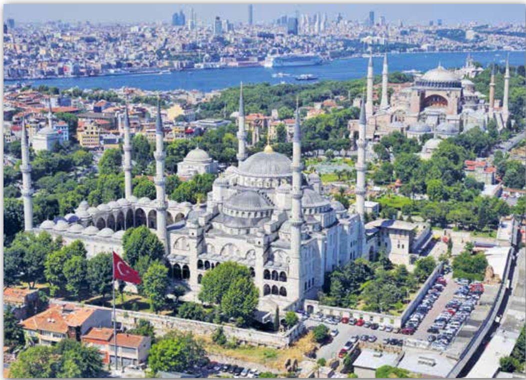
Блакітная мячэць (XVII ст.) і сабор Святой Сафіі (VI ст.) у Стамбуле, Турцыя