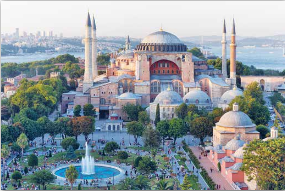
Анфімій і Ісідар. Сабор Святой Сафіі ў Канстанцінопалі (сучасны Стамбул), Турцыя (VI ст.)

Храм Святой Сафіі здзіўляе смелай архітэктурай. У параўнанні з самымі вялікімі сярэднявекавымі саборамі Еўропы — высокімі, але вузкімі і недастаткова асветленымі базілікамі — канстанцінопальскі храм уражвае сваёй