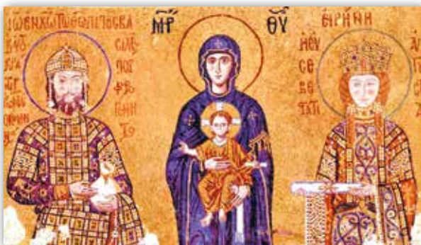
Імператар Канстанцін Манамах і імператрыца Зоя перад Хрыстом. Мазаіка сабора Святой Сафіі ў Канстанцінопалі (сучасны Стамбул), Турцыя (XI ст.)

дарыльшчыкаў, звычайна знаходзіліся каля ўвахода. Так было з мазаікай , на якой паказаны імператар Канстанцін Манамах і імператрыца Зоя , у саборы Святой Сафіі ў Канстанцінопалі. На ёй венцаносныя муж і жонка падносяць немаўляці Хрысту золата і дароўныя граматы.