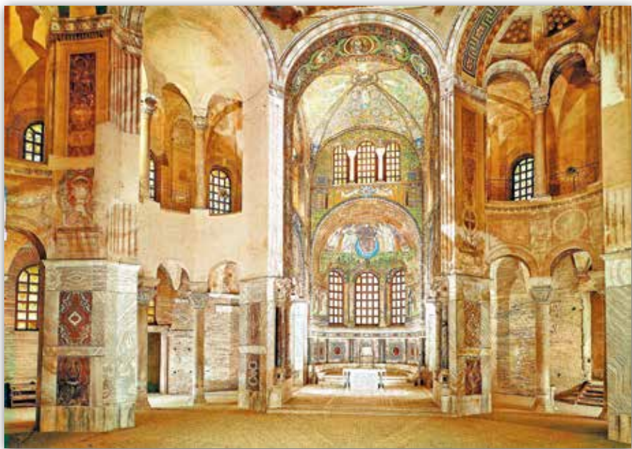
Інтэр'ер храма Сан-Вітале ў Равене, Італія (VI ст.)

Як і ў базіліцы, апсіда ў крыжова-купальнай царкве звычайна знаходзіцца з усходняга боку. Бо менавіта на ўсходзе ўзыходзіць сонца, якое сімвалізуе Царства Нябеснае. У апсідзе размяшчаецца алтар з прастолам , на якім адбываецца галоўнае хрысціянскае таінства — прычашчэнне Святых Дароў, гэта значыць ператварэнне хлеба і віна ў Цела і Кроў Хрыстовы.