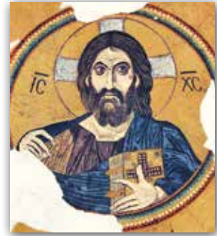
Хрыстос Пантакратар. Мазаіка храма Маці Божай у Дафні, Грэцыя (XI ст.)

Падобным чынам жывапіс быў арганізаваны і па восі «ўсход — захад». Паблізу алтара змяшчаліся вобразы Боскія, а свецкія выявы, напрыклад партрэты