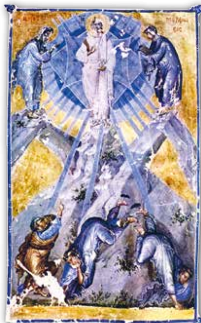
Праабражэнне. Мініяцюра рукапісу Іаана Кантакузіна (XIV ст.)