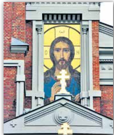
Хрыстос Пантакратар. Мазаіка капліцы Святаполк- Мірскіх у Міры, Беларусь (XX ст.)

4. У пачатку XX стагоддзя ў гарадскім пасёлку Мір побач з Мірскім замкам яго ўладальнікі князі Святаполк-Мірскія пабудавалі радавую капліцу-пахавальню. Яе фасад упрыгожыла створаная ў візантыйскіх традыцыях мазаіка з выявай Хрыста Пантакратара. Пры ўстаноўцы мазаіку прыйшлося абрэзаць, аднак вобраз застаўся выразным. Разгледзьце німб Хрыста. Чым ён адрозніваецца ад німбаў святых? Патлумачце яго сімваліку.