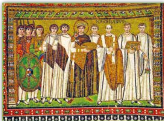
Імператар Юсцініян са світай. Мазаіка храма Сан-Вітале ў Равене, Італія (VI ст.)