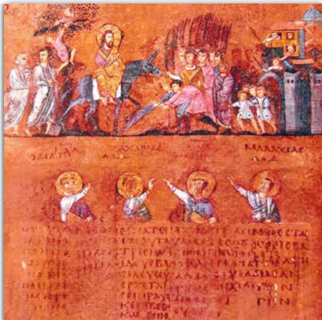
Уезд Хрыста ў Іерусалім. Мініяцюра Евангелля з Расана, Італія (VI ст.)

З часам у візантыйскіх кнігах усё больш становілася ілюстрацый, якія займалі асобныя старонкі. Заклучаныя ў рамкі, яны нагадвалі творы «вялікага» жывапісу і выглядалі як паўнаватасныя абразы. Менавіта такімі мініяцюрамі былі ўпрыгожаны багаслоўскія сачыненні імператара Іаана Кантакузіна. Адна