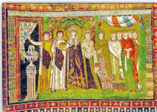
Імператрыца Феадора са світай. Мазаіка храма Сан-Вітале ў Равене, Італія (VI ст.)

сімвал вечнай сутнасці Бога. Мазаічныя выявы звычайна набіраліся на залатым фоне са смальты, перакладзенай залатой фальгой. Мільгаючы і пераліваючыся колерам і святлом, мазаікі з залатым фонам стваралі ілюзію нябачнай, але адчувальнай прысутнасці ў храме Боскага пачатку.