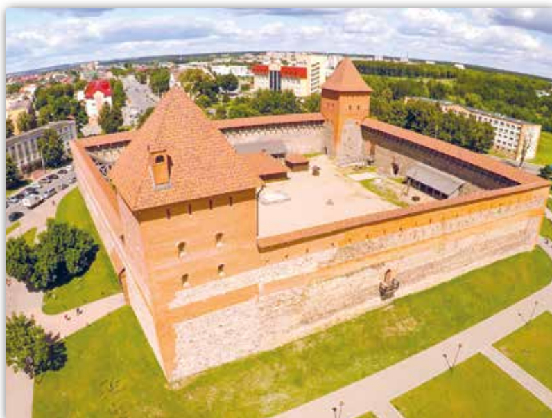
Лідскі замак, Беларусь (XIV ст.)

Пры будаўніцтве Лідскага замка Гедыміна выкарыстоўвалася тая ж тэхніка, што і пры ўзвядзенні Крэўскага замка. На першым этапе будаўніцтва Лідскі замак таксама складаўся толькі з масіўных сценаў з каменю і цэглы, якія ў падмурку былі шырынёй 2 метры. Вуглавыя вежы ў Лідскім замку з’явіліся не адразу. Канчатковае аблічча збудавання аформілася да XV стагоддзя. Байніцы ішлі па перыметры замка. Сцены на ўзроўні байніц завяршаліся баявой галерэяй. Фасады Лідскага замка дэкарыраваны поясам з так званых несапраўдных арак — элементаў, якія імітуюць аркі шляхам напуску камянёў.