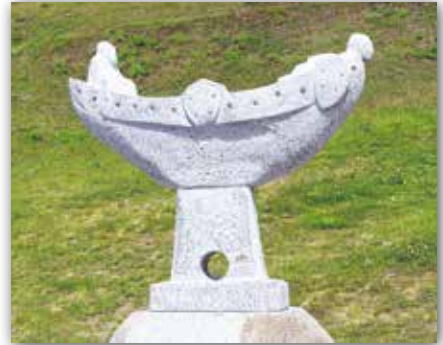
Уладзімір Панцялееў. Насада (2016 г.)

5. У 2016 годзе ў Гродне на набярэжнай ракі Нёман была ўстаноўлена скульптура Уладзіміра Панцялеева. Яна адлюстроўвае сярэднявекую хуткаходную ладдзю для вядзення бою на рацэ — насаду. Месца для ўстаноўкі скульптуры было выбрана не выпадкова: Нёман спрадвеку звязваў гарады і краіны. І сёння набярэжная ў Гродне з'яўляецца прывабным месцам для турыстаў. Прыдумайце сваю гісторыю, у якой будзе паказана сувязь ладдзі, воінаў і Нёмана.