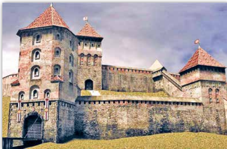
Алег Мініч. Навагрудскі замак. Камп'ютарная рэканструкцыя (XX ст.)

Дзякуючы сучасным панарамным фотаздымкам і рэканструкцыям мы можам уявіць грандыёзнае непрыступнае збудаванне. Падмуркі сцен і веж былі складзены з каменю, вышэй ішла цагляная муроўка. Вежы, што ўзводзілі ў розныя часы, размяшчаліся несіметрычна і мелі розныя формы. Аднак у цэлым замак з'яўляўся арганічным архітэктурным ансамблем. Пяць веж мелі форму прызмы. Дзве, пабудаваныя пазней, атрымалі форму «васьмярык на чацверыку» — васьмігранны аб'ём на кубе. У ніжняй частцы вежавых сцен былі прарэзаны байніцы для гармат, у верхняй — байніцы стральчатой формы. Маляўнічы від замку надаваў традыцыйны для беларускіх зямель дэкор — выбеленыя нішы.