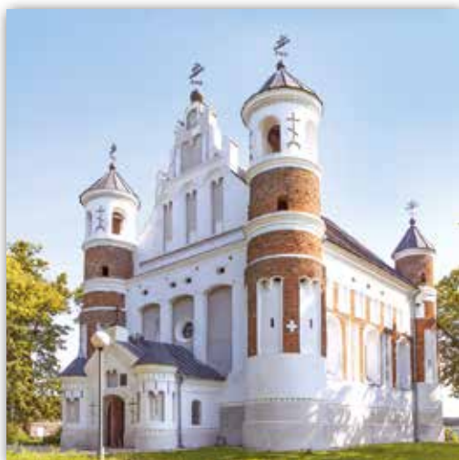
Царква Раства Багародзіцы ў в. Мураванка, Беларусь

Цікавай асаблівасцю храма з'яўляецца хвалісты конусападобны дах, які пакрывае не кожную апсідку асобна, а ўсе разам. Тры сцяны, размешчаныя па перыметры, прарэзаны круглымі байніцамі. Уверсе сцен размяшчаюцца навясныя байніцы. Гэтыя элементы, прызначаныя для вядзення бою, адыгрываюць і дэкаратыўную ролю — ствараюць рытмічны малюнак фасадаў.