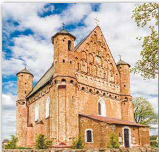
Царква Святога Міхаіла ў в. Сынковічы, Беларусь