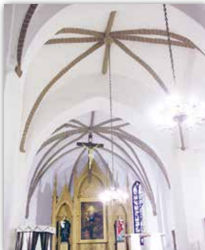
Троіцкі касцёл у в. Ішкалдзь, Беларусь

Троіцкі касцёл у вёсцы Ішкалдзь пабудаваны ў другой палове XV стагоддзя. Гэты касцёл з'яўляецца самым старым з захаваных і неперабудаваных храмаў такога тыпу. Ён складаецца з асноўнага аб'ёму, падзеленага на тры нефы, і вялікай, на ўсю шырыню корпуса, гранёнай апсіды. Атынкавалі фасады храма ў пазнейшыя часы. Чырвоныя цагляныя сцены касцёла раней былі ўпрыгожаны характэрным для беларускіх зямель спосабам: бяліліся толькі дэкаратыўныя дэталі архітэктуры. Галоўным упрыгажэннем унутранага прастору Ішкалдскага касцёла служаць крыжовыя гатычныя скляпенні. Іх малюнак стварае адчуванне ўзнёсласці і лёгкасці.