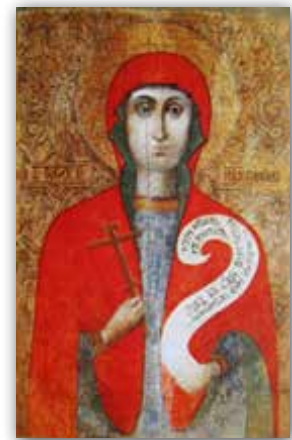
Святая Параскева. Абраз (XVI ст.)