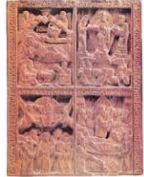
Ананія. Святы. Абразок (1499—1522 гг.)

У абразках, створаных свяшчэннікам Ананіям , ва ўстойлівай мастацкай традыцыі ярка праяўляецца аўтарскі пачатак. Мяркуюць, што абразкі Ананіі былі часткамі драўлянага складня, заказанага на мяжы XV—XVI стагоддзяў для пінскага князя Фёдара Яраславіча. Мініяцюрныя памеры абразкоў (6,6 см × 5,1 см × 0,4 см) не перашкодзілі майстру ўвасобіць складаны ідэі. Так, абразок « Святы » прадстаўляе найважнейшыя праваслаўныя святы, звязаныя з падзеямі жыцця Хрыста і Багародзіцы.