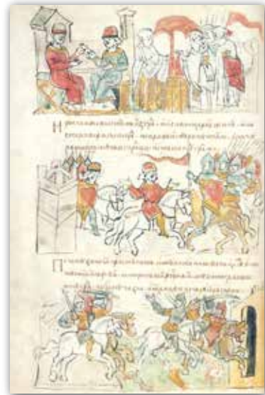
Мініяцюры Радзівілаўскага летапісу (XV ст.)