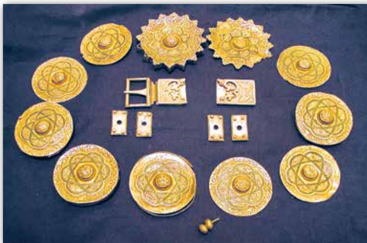
Пояс (канец XIV — XV ст.)