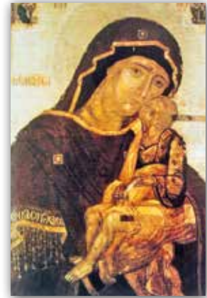
Маці Божая «Замілаванне». Абраз (XV ст.)

Некаторыя персанажы надзяляліся індывідуальнымі рысамі, як, напрыклад, у абразе «Святая Параскева» , што быў знойдзены ў пачатку XX стагоддзя ў Слуцкім раёне, а сёння захоўваецца ў Нацыянальным мастацкім музеі Рэспублікі Беларусь у Мінску. У творы выкарыстана аб'ёмнае мадэляванне твару. Мастак надаў ліку святой некаторую непасрэднасць і характэрную дэкаратыўнасць, якая праявілася ў буйным разьбяным арнаменце і яркім каларыце.