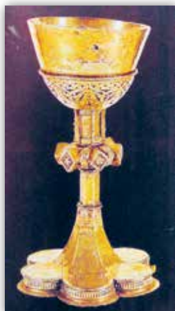
Пацір з Петрапаўлаўскай царквы г. п. Ружаны, Беларусь (пачатак XVI ст.)

Дэкаратыўна-прыкладное мастацтва. З XV стагоддзя на беларускіх землях узніклі першыя аб'яднанні рамеснікаў. Гарады сталі цэнтрамі рамеснай вытворчасці. Гэта паўплывала на ўзровень рамеснага майстэрства, тэхналогіі стварэння вырабаў і, адпаведна, на іх якасць.