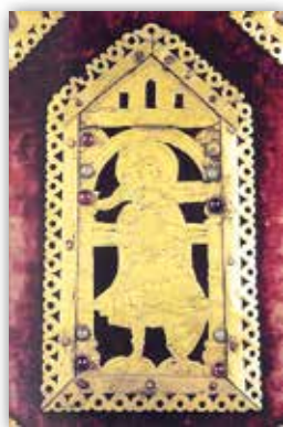
Абклад Лаўрышаўскага Евангелля (XVI ст.)

Сапраўдным творам ювелірнага мастацтва былі паясы, якія займалі ў касцюме рыцараў важнае месца. Пояс сімвалізаваў рыцарскі гонар, і ў баявых умовах менавіта да яго падвешвалі меч. Паясы або былі скуранымі, упрыгожанымі накладкамі з каштоўных металаў, або складаліся з металічных звёнаў. Адзін з такіх паясоў быў знойдзены каля вёскі Літва Маладзечанскага раёна. Спражка і наканечнік пояса выкананы ў гатычным стылі, а астатнія дэталі маюць усходнія матывы. Стыль выканання сведчыць пра тое, што пояс быў створаны немясцовымі майстрамі і ў якасці падарунка ці трафея мог трапіць да высокапастаўленай асобы.