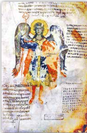
Архангел Міхаіл. Мініяцюра Лаўрышаўскага Евангелля (XIV ст.)

Адзін з самых яркіх помнікаў рукапіснай кнігі XV стагоддзя — Радзівілаўскі (або Кёнігсбергскі) летапіс . Ён доўгі час