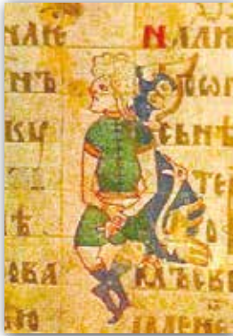
Ініцыялы Мсціжскага Евангелля (XIV ст.)

Кніжная мініяцюра. У кніжнай мініяцюры XIV стагоддзя панавалі «звярыны стыль». Для яго характэрныя камбінацыі мудрагелістых выяў фантастычных жывёл і людзей. Часам у дэкары ініцыялаў выкарыстоўваліся нават жанравыя сцэнкі. Напрыклад, на старонках Мсціжскага Евангелля, якое, магчыма, было створана ў Мінску, а затым захоўвалася ў царкве вёскі Мсціж, мы бачым забаўныя выявы людзей, занятых паўсядзённымі клопатамі: адзін з іх працуе рыдлёўкай, побач з другім гусак.