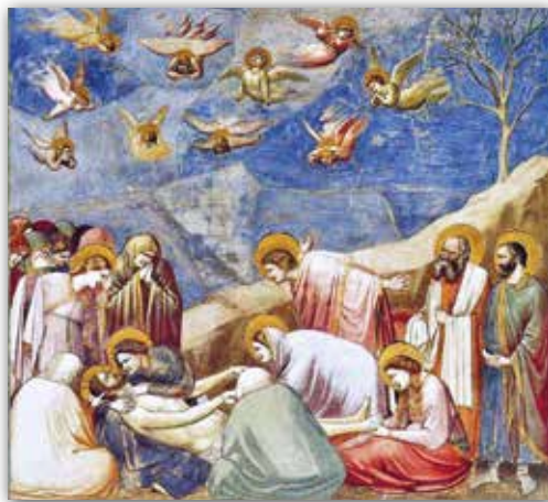
Джота дзі Бандоне. Аплакванне Хрыста. Фрэска ў капэле дэль Арэна ў Падуі, Італія (пачатак XIV ст.)

Так, напрыклад, на фрэсцы « Аплакванне Хрыста » ў цэнтры кампазіцыі вядомы італьянскі мастак Джота дзі Бандоне размясціў фігуры Хрыста і Марыі. Яны сталі ключавымі вобразамі, якія падпарадкавалі ўвесь кампазіцыйны лад. Да іх звернуты астатнія персанажы. Уверсе мы бачым анёлаў, якія лунаюць у нябёсах. Выразы твараў і нябесных, і зямных удзельнікаў сцэны паказваюць, што ўсе яны перажываюць трагічную падзею. Гэта відаць, перш за ўсё, у міміцы і паставах, якія перадаюць розныя ступені пакуты. Марыя Магдаліна плача каля ног Хрыста, у рухах іншых мы заўважаем абурэнне. Праведныя мужчыны выяўляюць скруху страты больш стрымана. Некаторыя фігуры на пярэднім плане паказаны са спіны. Дзякуючы гэтаму глядач становіцца бліжэй да таго, што адбываецца: мастак нібы запрашае нас стаць побач з персанажамі.