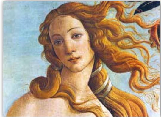
▲ Бацічэлі. Нараджэнне Венеры (фрагмент) (1482—1486 гг.)