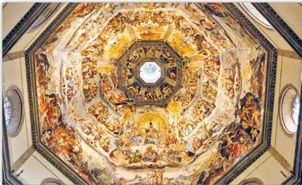
Архітэктар Філіпа Брунелескі, мастакі Джорджа Вазары, Федэрыка Цукары. Купал сабора Санта-Марыя-дэль-Ф'ёрэ (выгляд знутры) (XV ст.)

Знутры купал успрымаецца яшчэ большым дзякуючы аптычнай ілюзіі, якая стварае эфект скіраванасці купальнай формы ўвышыню. Менавіта