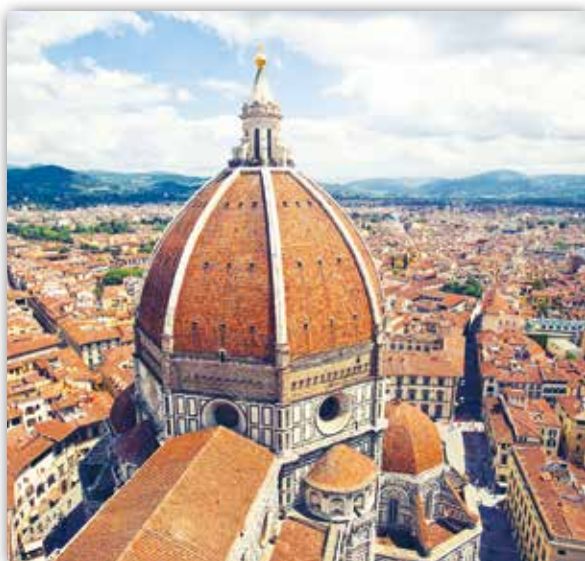
Філіпа Брунелескі. Купал сабора Санта-Марыя-дэль-Ф'ёрэ ў Фларэнцыі, Італія (1436 г.)

Прамая лінейная перспектыва (ад лац. «ясна бачу») вучыць перадаваць прадметы на плоскасці так, як іх бачыць вока чалавека. Гледачу здаецца, што прадметы памяншаюцца па меры аддалення ад яго.