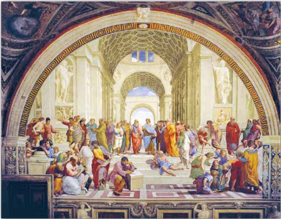
Рафаэль. Станца дэла Сеньятура (фрагмент з фрэскай «Афінская школа») (1509—1511 гг.)

Пошук гармоніі выявіўся ў роспісах парадных апартаментаў — станц — у палацы Ватыкана. Найбольш вядомымі з'яўляюцца роспісы Залы подпісаў , або Станцы дэла Сеньятура , — залы, у якой папа рымскі змацоўваў пячаткай указы. У ёй размешчаны чатыры кампазіцыі, кожная з якіх прысвечана аднаму з бакоў духоўнага свету чалавека. Сярод іх вылучаецца фрэска «Афінская школа» . У аснове яе сюжэта — філасофскі дыспут аб адзінстве навукі і рэлігіі. У адной кампазіцыі Рафаэль аб'яднаў самых вядомых мысліцеляў розных краін і эпох. Кожны з іх займаецца сваёй справай — гутарыць, чытае кнігу, чэрціць.