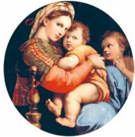
Рафаэль. Мадонна ў крэсле (1513—1514 гг.)

Аднак улюбёным для Рафаэля стаў вобраз Мадонны. Невыпадкава яго называюць «майстрам ясналікіх мадоннаў». Вобразы яго герайнь выключна прывабныя. Але гэтая прывабнасць асаблівая: пакорлівая і цнатлівая, яна нібы свеціцца знутры пяшчотнай любоўю да сына. Адною з самых чароўных мадоннаў Рафаэля лічаць Мадонну ў крэсле . Мяркуецца, што яна напісана з простаю жанчыны. Менавіта таму замест традыцыйнай вопраткі на Марыі зялёны шаль з махрамі і стракатая хустка на валасах, якія ў той час насілі сялянкі ў ваколіцах Рыма. Паводле легенды, Рафаэль убачыў гэтую маладую жанчыну з дзіцём на руках, калі яна сядзела на прыступках царквы. Уражаны яе прыгажосцю, ён тут жа захацеў пісаць з яе Мадонну. А паколькі пад рукой у мастака не аказалася палатна, ён выбіў дно з бочачкі, што ляжала побач, і зрабіў накід адразу на ёй.