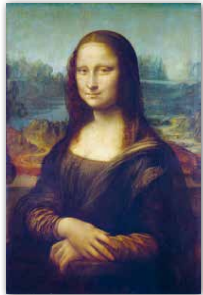
Леонарда да Вінчы. Мона Ліза (1503—1519 гг.)

Самай загадкавай работай Леонарда прызнана карціна «Мона Ліза» (або «Джаконда»). Да цяперашняга часу дакладна невядомае імя жанчыны, паказанай на ёй. Па адной з версій, гэта была знатная дама Ліза дэль Джаконда. Асабліваю прывабнасць і адначасова адчуванне таямніцы надае герайні ледзь прыкметная ўсмешка. Само аблічча напісана ў цёплых тонах, а фон вытрыманы