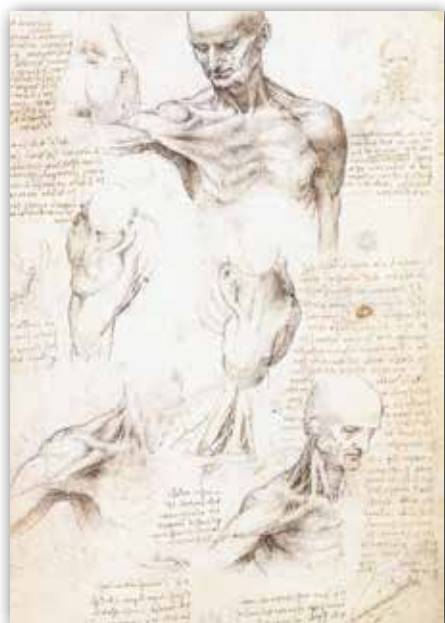
Леанарда да Вінчы. Накіды з дзённіка (XV ст.)

Свае назіранні за з'явамі навакольнага свету мастак зафіксаваў у шматлікіх накідах і запісах у дзённіках. Яны сведчаць, наколькі важным для майстра з'яўляўся навуковы падыход, у тым ліку ў мастацкай творчасці. Напрыклад, на яго карціне «Мадонна ў гроте» паказаны