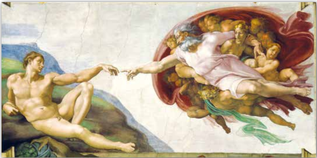
Мікеланджэла. Стварэнне Адама (каля 1511 г.)

Праз дзесяцігоддзе Мікеланджэла атрымаў новы заказ — упрыгожыць роспісамі скляпенне Сіксіёнскай капэлы ў Ватыкане . За чатыры гады майстар распісаў скляпенне, у цэнтры якога размясціў дзевяць галоўных кампазіцый. Адной з самых выбітных стала фрэска «Стварэнне Адама» , якая ілюструе біблейскі эпізод: «І стварыў Бог чалавека паводле вобраза Свайго...» На ёй паказаны момант, калі Тварэц надзяляе жыццём першага чалавека на зямлі. У імклівым палёце, нібы ў віхуры