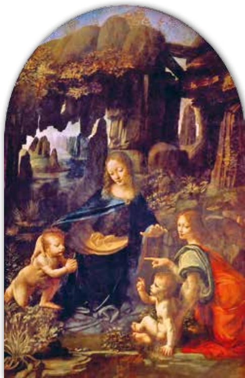
Леанарда да Вінчы. Мадонна ў гроте (1483—1486 гг.)