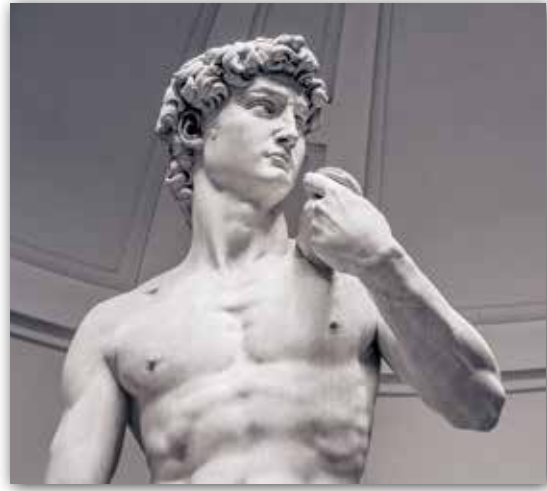
▲ Мікеланджэла. Давід (фрагмент) (1504 г.)