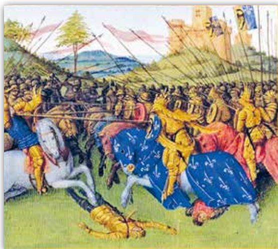
Жан Фуке. Карл Вялікі ў бітве. Мініяцюра з « Вялікіх французскіх хронік » (каля 1458 г.)

Параўнайце мініяцюры братоў Лімбург і Жана Фуке. Пры дапамозе якіх сродкаў выразнасці мастакі перадаюць глыбіню прасторы? У якой мініяцюры, на ваш погляд, мастак больш ярка і шчыра паказвае асабістае стаўленне да персанажаў?