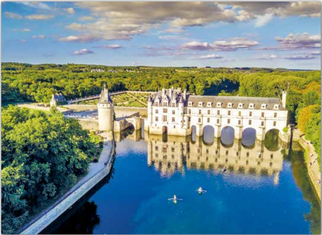
Замак Шэнансо, Францыя (1512—1523 гг.)

Рэнесансныя ідэі ярка праявіліся ў архітэктуры Францыі. Культурнае жыццё засяродзілася ў замках, пры ўзвядзенні якіх дойліды злучылі прыгажосць навакольнай прыроды і строга вывераную гармонію пабудовы. Замак Шэнансо размешчаны на штучнай выспе ракі Шэр. Цэнтральны аб'ём замка ўвянчаны чатырма вежамі і шпілямі. А яго крыло — перакінутае праз раку корпус з пяццю