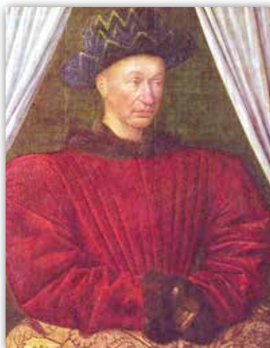
Жан Фуке. Партрэт Карла VII (сярэдзіна XV ст.)