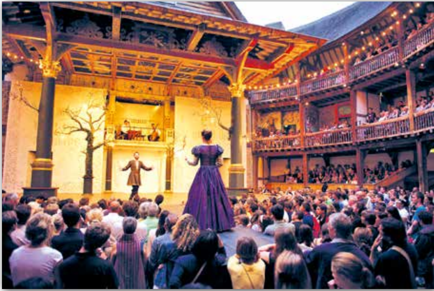
Адноўлены будынак тэатра «Глобус» у Лондане, Англія

Персанажы камедыі — кіраўнікі, бацькі, маладыя героі, слугі, блазны — разважаюць пра сямейныя і сацыяльныя адносіны. Але ў цэлым дзеючых асоб камедыі п'ес не хвалюць глабальныя грамадскія праблемы, яны пераважна занятыя асабістымі справамі. Напрыклад, у камедыі «Дванаццатая ноч» маладыя гераіні спрабуюць самастойна вырашыць уласны лёс.