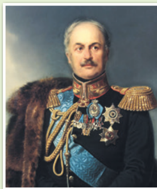
П. Д. Киселев. Портрет XIX в.

Определите причину проведения реформы среди государственных крестьян в западных губерниях.