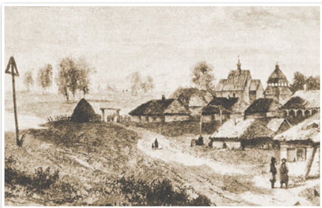
Белорусская деревня. Середина XIX в.

Нормы и формы повинностей. Крепостные крестьяне были обязаны выполнять в пользу помещика различные повинности, закрепленные в инвентарях. Традиция составления инвентарей существовала в Беларуси еще с XVI в. В них владельцы вносили данные о границах