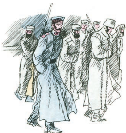
Ил. В. Л. Гальдяева

Какой последний аргумент привёл губернатор? Что ожидал чиновник от молодой женщины?