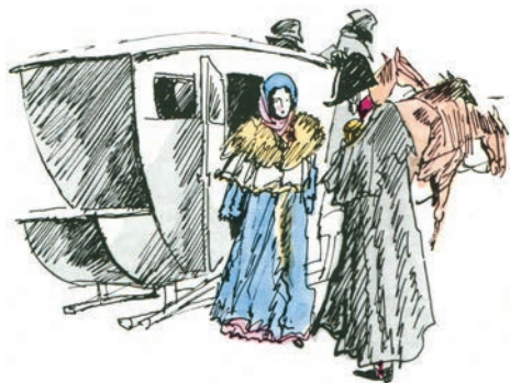
Ил. В. Л. Гальдяева

Оцените последние слова губернатора (когда он не смог уговорить княгиню) с позиции нравственности.