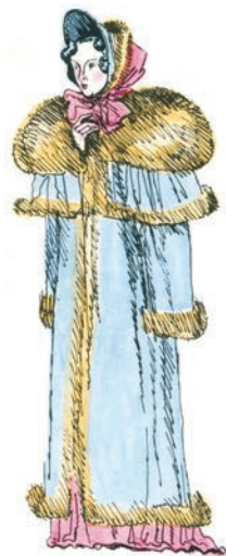
Ил. В. Л. Гальдяева

Перечитайте начало поэмы. Почему у героев нет имён? С помощью каких средств поэт передаёт напряжённость и драматизм ситуации расставания?