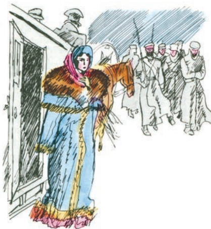
Ил. В. Л. Гальдяева

Найдите средства художественной выразительности, использованные автором, чтобы передать впечатления княгини от встречи с каторжанами.