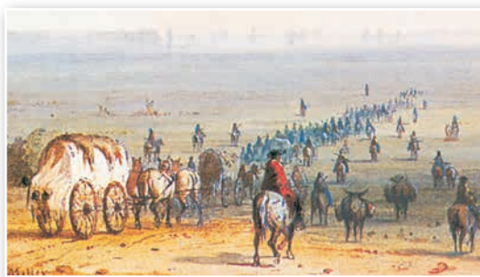
Перасяленцы. Малюнак першай паловы XIX ст.

2. Заваяванне Дзікага Захаду. Гэта адна з найбольш захапляльных старонак амерыканскай гісторыі. Першапачаткова, як вы ведаеце, еўрапейскія перасяленцы асвойвалі ўсходняе (атлантычнае) узбярэжжа. Толькі самыя адважныя падарожнікі — піянеры , г. зн. «першыя», прабіраліся ў глыб мацерыка, у раён ракі Місісіпі і Вялікіх азёр. Перасяленцы былі ўпэўненыя, што тэрыторыя, на якой яны спыніліся, нікому, акрамя іх, не належыць.