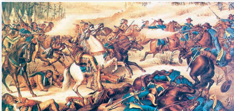
Бой перасяленцаў з індзейцамі

Разгледзьце ілюстрацыі на с. 73 і 74 і вызначце сваё стаўленне да наступстваў асваення Дзікага Захаду перасяленцамі для краіны ў цэлым і яе карэннага насельніцтва.