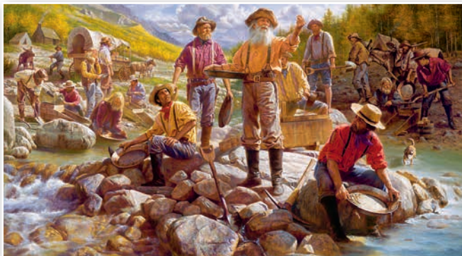
Здабыча золата. Мастак А. Радрыгес. XXI ст.

Выкарыстоўваючы малюнак і дадатковыя крыніцы інфармацыі, раскажыце аб «заламай ліхаманцы».