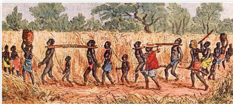
Калона звязаных афрыканцаў пад узброенай аховай. Цэнтральная Афрыка. Другая палова XIX ст.

Плантацыйная гаспадарка была заснаваная не на свабоднай працы наёмных людзей, а на нявольніцкай працы чарнаскурых рабоў. Таму плантатары былі зацікаўленыя ў захаванні гандлю рабамі.