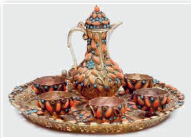
Кававы сервіз, інкруставаны караламі і бірузой. Турцыя. XIX ст.