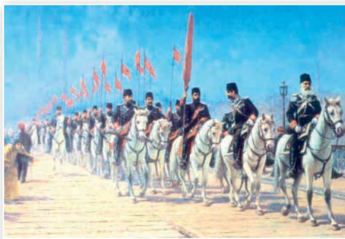
Турэцкая кавалерыя. Мастак Ф. Занара. Пачатак XX ст.

Разгледзьце карціну і параўнайце яе з ілюстрацыяй «Брытанскія войскі ў Кітаі» на с. 28. Вызначце, якія з гэтых войскаў, на ваш погляд, з'яўляюцца больш баяздольнымі. Чаму?