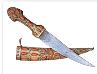
Іранскі кінжал. XIX ст.