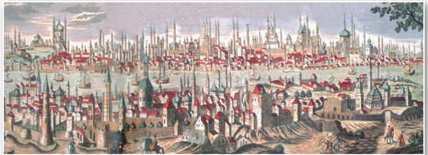
Сталіца Асманскай імперыі — горад Стамбул

1. Пранікненне еўрапейскіх дзяржаў у мусульманскія краіны. Барацьба еўрапейскіх дзяржаў за Іран. У XIX ст. актыўную барацьбу за Іран вялі Англія і Расія. Сфарміраваліся сферы ўплыву дзвюх дзяржаў: Англіі — на поўдні краіны, Расіі — на поўначы, уключаючы Тэгеран.