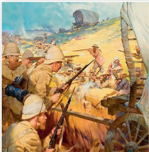
Бітва бураў з англічанамі. Мастак Дж. Э. Мак-Конел. XX ст.

Якія асаблівасці англа-бурскай вайны вы можаце назваць?