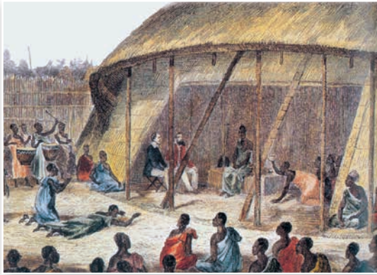
Еўрапейскія падарожнікі на прыёме ў караля Буганды (цяпер Уганда). Малюнак XIX ст.

Еўрапейская экспансія ў глыбінныя вобласці Афрыканскага кантынента ў XIX ст. стала магчымай дзякуючы маштабным геаграфічным даследаванням.