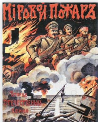
Плакат часоў Першай сусветнай вайны

Пасля правалу стратэгіі бліцкрыгу і ўступлення вайны ў зацяжную фазу нямецкая эканоміка стала даваць збоі. Прыпынілася грамадзянская прамысловая вытворчасць. Ужо з лютага 1915 г. у Германіі было ўведзенае жорсткае размеркаванне прадуктаў харчавання, а ў 1916 г. — карткавая сістэма. У тым жа годзе быў прыняты закон аб абавязковай працоўнай павіннасці для мужчын ад 17 да 60 гадоў. На ваенных заводах шырока выкарыстоўвалася жаночая і дзіцячая праца. З кожным годам ваенная прамысловасць усё больш адчувала дэфіцыт сыравіны і матэрыялаў.