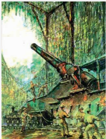
Амерыканская 305-міліметровая гармата. Мастак Р. Стэнлі-Браўн. Першая палова XX ст.

(каля 1 млн чалавек). Стратэгічная ініцыятыва канчаткова перайшла да дзяржаў Антанты.