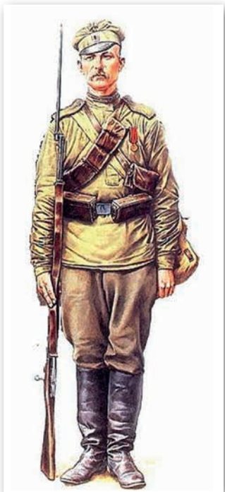
Пехацінец расійскай арміі