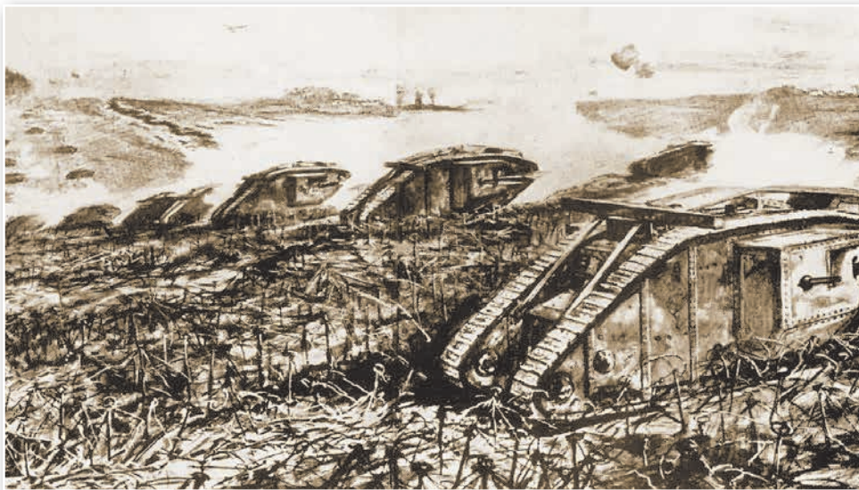
Масавая танкавая атака англійскіх войскаў ля французскага горада Камбрэ

У красавіку 1917 г. магутны наступ у раёне Араса і Рэймса арганізаваў французскі галоўнакамандуючы Р. Ж. Нівель. У гэтым наступе ўдзельнічала звыш 100 дывізій, выкарыстоўваліся танкі і самалёты. Баі былі ўпартыя і кровапралітныя. Усё новае і новае сілы кідаў у бітву генерал Нівель, але прарваць нямецкі фронт не ўдалося. Саюзнікі дарага заплацілі за гэтую няўдалую аперацыю. За некалькі дзён баёў французы страцілі 122 тыс. чалавек забітымі і параненымі, англічане — 80 тыс. У Францыі гэтую бессэнсоўную бойню ахрысцілі «мясарубкаю Нівеля».