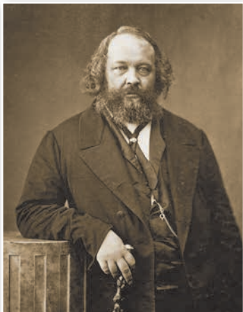
М. А. Бакунін

Пракаментуйце погляды анарха-сіндыкалістаў на дзяржаўную ўладу і арганізаваную палітычную барацьбу.