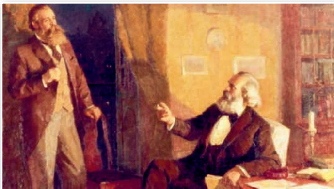
К. Маркс і Ф. Энгельс. Мастак Г. Гордан. XX ст.

Падумайце і вызначце асноўную думку створанай мастаком карціны.