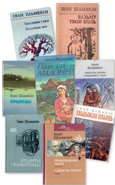
▲ Вокладкі кніг Івана Шамякіна

Пасля «Глыбокай плыні» з’явіліся іншыя раманы: «У добры час», «Крыніцы», «Трывожнае шчасце». Апошні — пенталогія, складаўся з 5 аповесцей. З іх першая — «Непаўторная вясна» (1957), аповесць пра каханне, вернасць, чалавечую сардэчнасць, абавязак, патрыятызм.