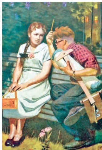
А. Кітаеў. На спатканні ►

Разгледзьце рэпрадукцыю карціны Ахмеда Кітаева «На спатканні». Знайдзіце ў тэксце аповесці «Непаўторная вясна» і зачытайце радкі, якія, на вашу думку, найбольш адпавядаюць сюжэту карціны.