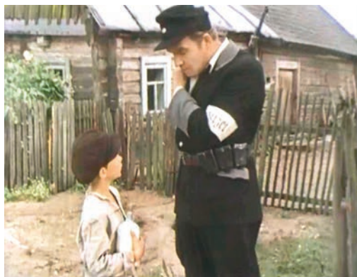
Кадр з фільма «Вазьму твой боль» (рэж. М. Пташук) ►

Звярніцеся да дадатковай літаратуры, інтэрнэт-рэсурсаў і падрыхтуйце паведамленне «Творы І. Шамякіна ў тэатры і на экране».