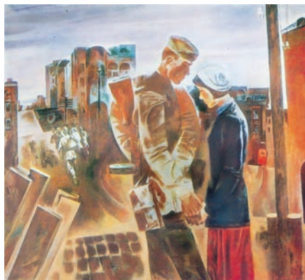
Л. Шылаў. Развітанне ►

Як суадносіцца карціна Леаніда Шылава «Развітанне» з падзеямі жыцця, з пачуццямі і перажываннямі герояў твора?