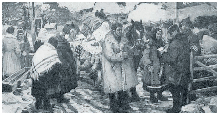
▲ В. Жолтак. Вясна. 1930-я гг.

Якія характэрныя прыметы 1930-х гадоў адлюстраваны ў творах Івана Шамякіна і Валярыяны Жолтак?