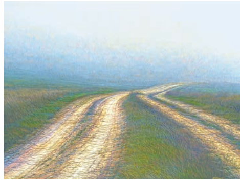
В. Шкаруба. Дарога ►

Якая роля адведзена вобразу дарогі ў творы? Звярніцеся да рэпрадукцыі карціны Валерыя Шкарубы «Дарога». Што, на вашу думку, дазваляе суаднесці яе з аповесцю «Непаўторная вясна»?