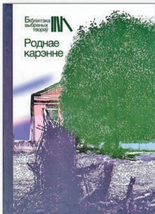
▲ Вокладка зборніка апаবাদанняў «Роднае карэнне»

«Помні, што, каб другога вызваляць, трэба самому крэпкім быць, на сілы не ўпадаць, а то і самога затопчуць...»