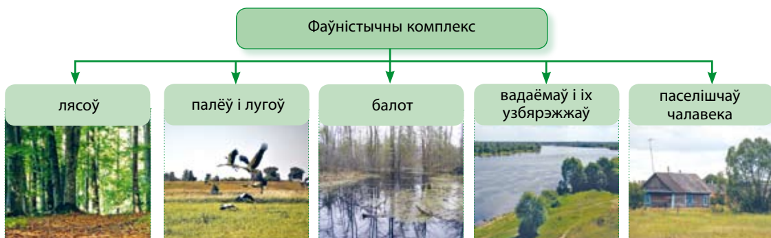
Мал. 57. Групоўка жывёл па месцах пражывання

Жывёльны свет лясоў. Па месцах пражывання жывёлы групуюцца ў фаўністычныя комплексы лясоў, палёў і лугоў, балот, вадаёмаў і іх узбярэжжаў, паселішчаў чалавека (мал. 57). Найбольш багаты і разнастайны жывёльны свет лясоў. Звязана гэта з наяўнасцю ў лясах вялікай колькасці корму і хованак. Звычайнымі насельнікамі лясоў з’яўляюцца лось, казуля, вавёрка, дзік, воўк, лясная куніца.