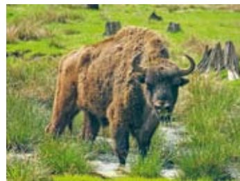
Мал. 58. Прадстаўнік фаўністычнага комплексу лясоў — зубр

Жывёльны свет фаўністычнага комплексу залежыць ад тыпаў лесу. У барах ён бяднейшы, у ельніках, багацейшых кармамі, з лепшымі хованкамі, — больш разнастайны. Шмат у ельніках птушак: клёст, сініца, сойка, дзяцел. Яшчэ больш разнастайны жывёльны свет змешаных лясоў. У іх шмат хованак і багацейшае харчаванне. Тыповымі прадстаўнікамі з’яўляюцца дзік, казуля, высакародны алень, лясная куніца, больш за 180 відаў птушак. Сярод іх зязюля, салавей, шчыгол, цецярुक, сава, ястраб, арлан-белахвост і інш. У забалочаных лясах поўначы Беларусі сустракаецца буры мядзведзь. У Белавежскай пушчы жыве самы буйны прадстаўнік млекакормячых нашых лясоў — зубр (мал. 58). Шырока прадстаўлена ў лясах і фаўна земнаводных і паўзуноў.