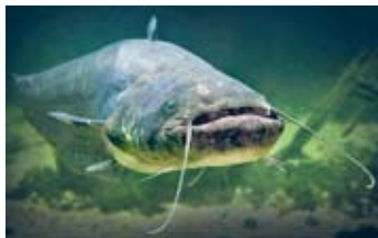
Мал. 60. Прадстаўнік фаўністычнага комплексу вадаёмаў — сом

Жывёльны свет балот. З-за неспрыяльных умоў пражывання жывёльны свет балот не багаты. Прадстаўлены земнаводныя і паўзуны: жабы, вужы, гадзюкі. На поўдні краіны сустракаецца балотная чарапаха. З млекакормячых на лясныя балоты заходзяць лось, дзік, казуля, сустракаюцца гарнастай, норка. Своеасаблівая фаўна птушак: чаплі, кулікі, журавы, качкі, балотныя совы і інш.