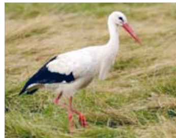
Мал. 59. Прадстаўнік фаўністычнага комплексу палёў і лугоў — бусел

Жывёльны свет палёў і лугоў. Тыповымі насельнікамі палёў і лугоў з'яўляюцца грызуны: палёўка шэрая, мыш палявая, буразубка, на поўдні — хамяк, суслік. Тут можна сустрэць зайца, крата, вожыка, з драпежнікаў — лісіцу, гарнастая, тхара, ласку. Найбольшай разнастайнасцю адрозніваецца фаўна птушак, якая ўключае перапёлак, курапатак, жаўрукоў, белых буслоў (мал. 59). Земнаводныя і паўзуны прадстаўлены яшчаркамі, жабамі. Шмат на палях і лугах насякомых, у тым ліку шкоднікаў сельскагаспадарчых культур.