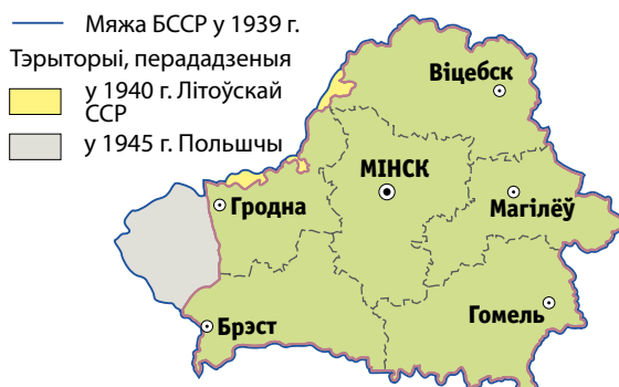
Мал. 4. Тэрыторыя Беларусі ў 1930–1940-х гг.

108 тыс. км 2 з насельніцтвам каля 4,6 млн чалавек увайшла ў склад Польшчы. У складзе БССР засталася толькі 6 павеятаў Мінскай губерні. Плошча рэспублікі скарацілася да 52 тыс. км 2 . Пасля вяртання 17 павеятаў Віцебскай, Магілёўскай, Гомельскай і Смаленскай губерняў у 1924–1926 гг. плошча БССР павялічылася да 125 тыс. км 2 , а насельніцтва — да 5 млн чалавек (мал. 3). Наступнае ўдакладненне межаў Беларусі адбылося ў 1930–1940-х гг. У верасні 1939 г. у склад БССР увайшла Заходняя Беларусь, і плошча краіны складала 234 тыс. км 2 . У 1940 г. частка зямель Віленскай вобласці была перададзена Літве, а ў 1946 г. за Польшчай замацаваны 20 раёнаў Беластоцкай і Брэсцкай абласцей (мал. 4). Апошняе ўдакладненне межаў паміж Смаленскай і Магілёўскай абласцямі адбылося ў 1964 г., пасля чаго дзяржаўныя межы Беларусі не змяняліся.