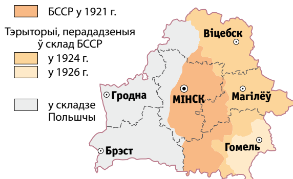
Сучасныя межы Беларусі