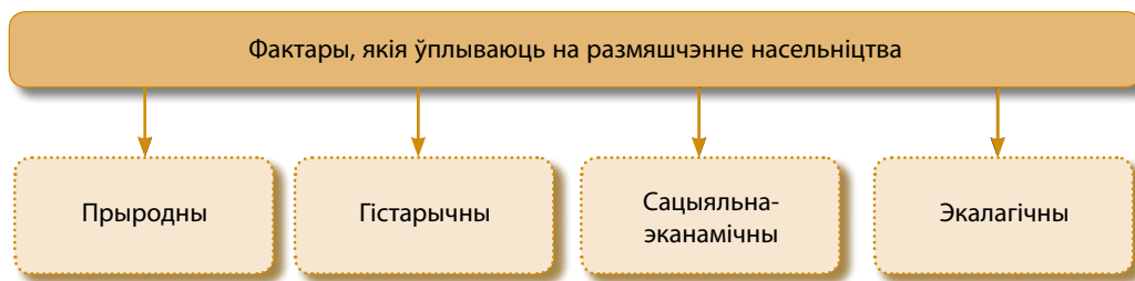
Мал. 94. Фактары, якія ўплываюць на размяшчэнне насельніцтва

Размяшчэнне насельніцтва. Пад размяшчэннем насельніцтва разумецца яго размеркаванне на пэўнай тэрыторыі і фарміраванне сеткі паселішчаў. Да асноўных фактараў размяшчэння насельніцтва можна аднесці прыродны, гістарычны, сацыяльна-эканамічны і экалагічны (мал. 94). Гістарычна адным з галоўных фактараў размяшчэння насельніцтва быў прыродны. Людзі сяліліся на раўнінных тэрыторыях або каля прыродных вадаёмаў. Якія віды асваення тэрыторыі звязаны з прыродным фактарам? Важнае значэнне меў гістарычны фактар, які выяўляўся ў асаблівасцях засялення рэгіёнаў. У цяперашні час прыродны і гістарычны фактары аслабелі. Размяшчэнне насельніцтва рэгулююць сацыяльна-эканамічныя ўмовы жыцця: развіццё вытворчасці, сферы паслуг, наяўнасць транспартных шляхоў і інш. У апошнія гады павялічылася значэнне экалагічнага фактару. Пасля аварыі на ЧАЭС многія тэрыторыі сталі непрыдатнымі для пражывання людзей. Якія геаэкалагічныя праблемы аказалі ўплыў на размяшчэнне насельніцтва?