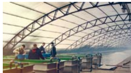
Мал. 115. Рыбгас «Волма»

Пераважна на базе вадасховішчаў і азёр рыбалоўствам і развядзеннем рыб займаюцца рыбгасы. У цяперашні час у Беларусі налічваецца 16 рыбгасаў, 8 рыбагадавальнікаў, створаны рыбныя сажалкі шэрага сельскагаспадарчых прадпрыемстваў і дапаможных гаспадарак прамысловых прадпрыемстваў (мал. 115). Рыбгасы размешчаны ў асноўным у Брэсцкай і Мінскай абласцях, рыбагадавальнікі — у Віцебскай. Тут разводзяць карпа, белага амура, таўсталобіка, карася, сома, фарэль, сцерлядзь.