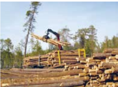
Мал. 114. Лесанарыхтоўка

Лесанарыхтоўка драўніны ў цяперашні час штогод павялічваецца і складае крыху больш за 19 млн м 3 ліквіднай драўніны.