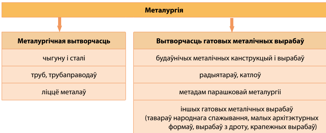
Мал. 123. Структурная схема металургіі Беларусі

Структура і фактары размяшчэння металургічнай вытворчасці. У структуры апрацоўчай прамысловасці Беларусі доля металургіі складае 7,4 %. Металургія адыгрывае важную ролю ў эканоміцы. Яна выпускае металы і шырокі асартымент гатовых вырабаў для прамысловасці, сельскай і лясной гаспадаркі, будаўніцтва, тавараў для народнага спажывання (мал. 123). У металургічны комплекс краіны ўваходзяць каля 20 буйных і сярэдніх прадпрыемстваў, якія вырабляюць сталёвыя трубы, металакорд,